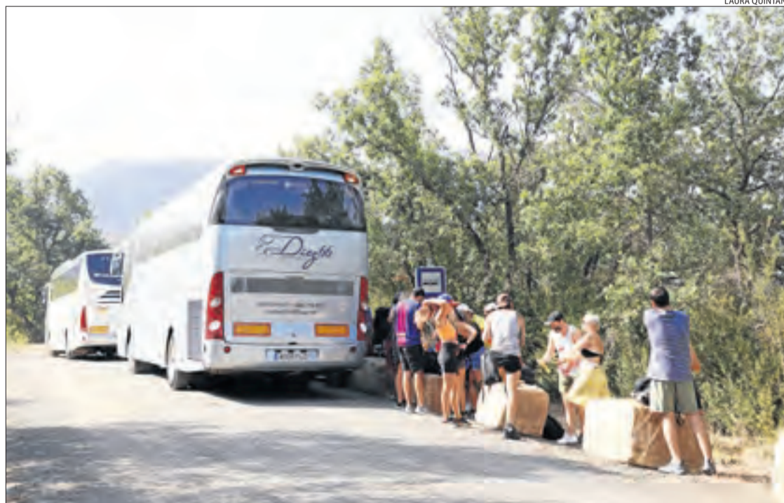
Autocars estacionats a l'entrada de Mont-rebei.