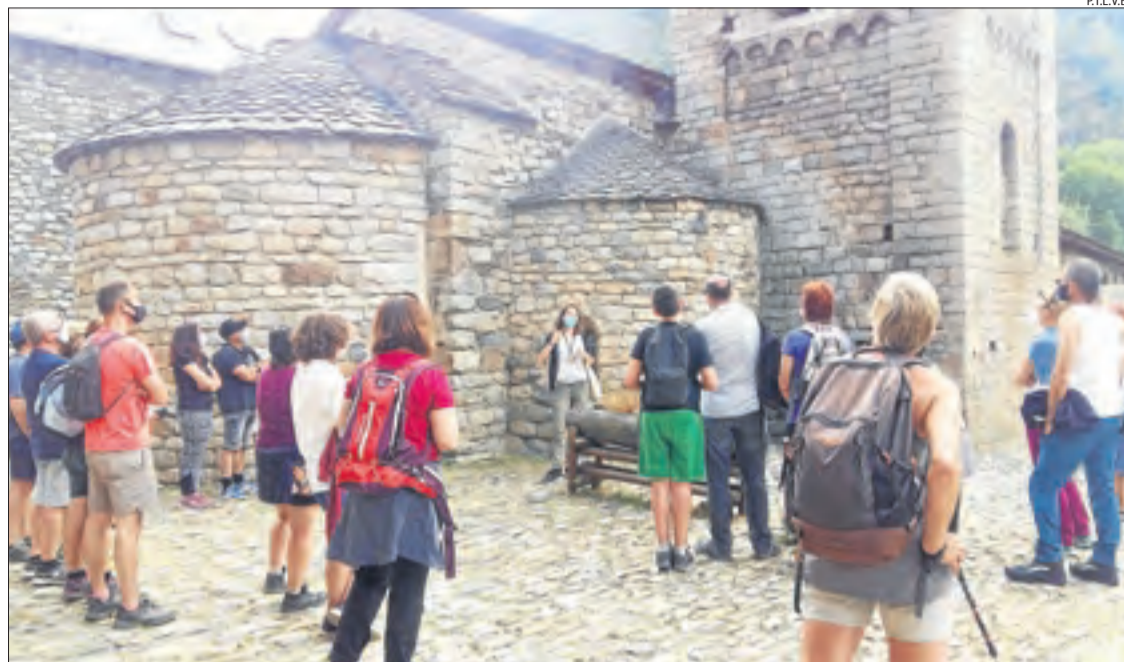
El Patronat de Turisme ha organitzat visites guiades al voltant de les esglésies romàniques.