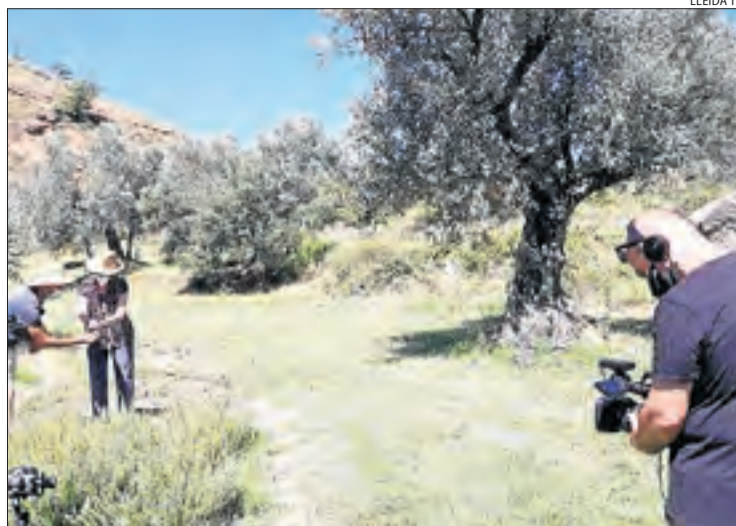
L'equip de Lleida TV, al Parc de les Olors de Claverol.

La ruta per la comarca començarà a la central hidroelèctrica de Talarn, un lloc en el qual els espectadors podran saber per què se solia dir que el