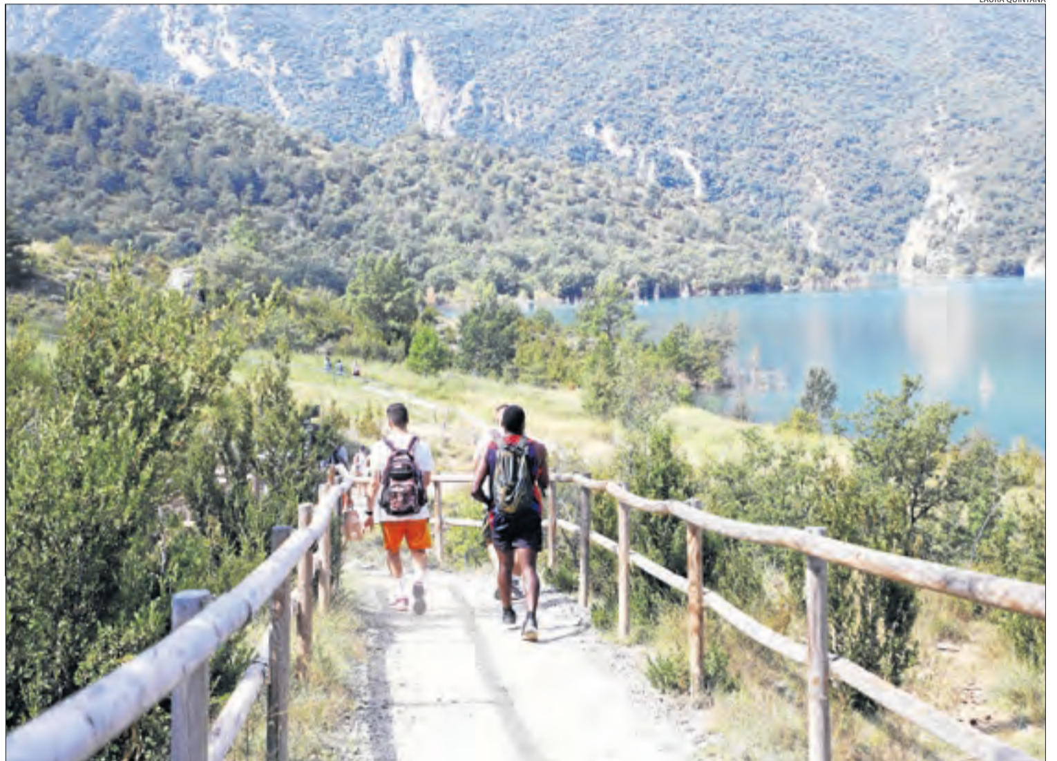
Excursionistes començant a fer la ruta per arribar al congost de Mont-rebei des de Sant Esteve de la Sarga.

El sector dels esports d'aventura també fa un molt bon balanç, ja que va arribar al 100% dels serveis en hores punta, encara que la producció mitjana de totes les empreses que treballen al Pallars Sobirà és d'un 85%. Amb tot, el seu responsable en aquesta comarca, Florido Dolcet, va indicar que és un cap de setmana de rècord des que va començar el ràfting a mitjans del juny. Va incidir que, a banda del ràfting, totes les activitats relacionades amb l'aigua com ara el barranquisme o l'hidrospeed també estan funcionant molt bé. També hi ha demanda per a altres activitats, com ara