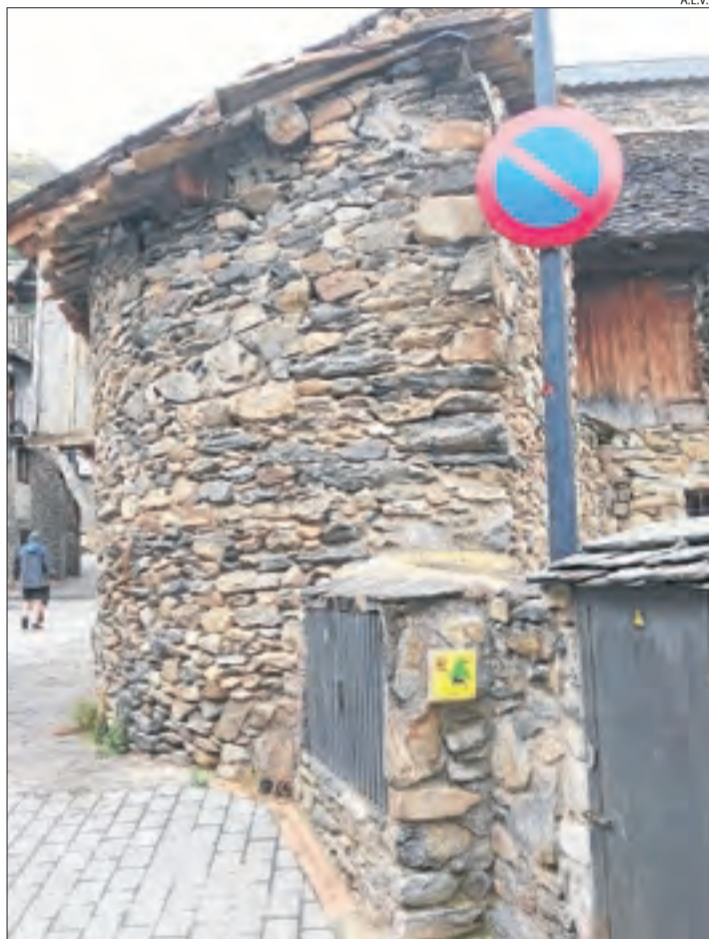
Un dels senyals que veten estacionar a Durro.

s'han col·locat indicadors que informen d'aquesta prohibició. "No es pot trobar gent pernottant amb cotxe en un lloc que està protegit. Aquesta és una pràctica habitual en els mesos en què hi ha molts turistes, com passa ara, i que hem decidit eradicar", va explicar l'alcaldesa. Totes aquestes mesures busquen evitar massificacions.