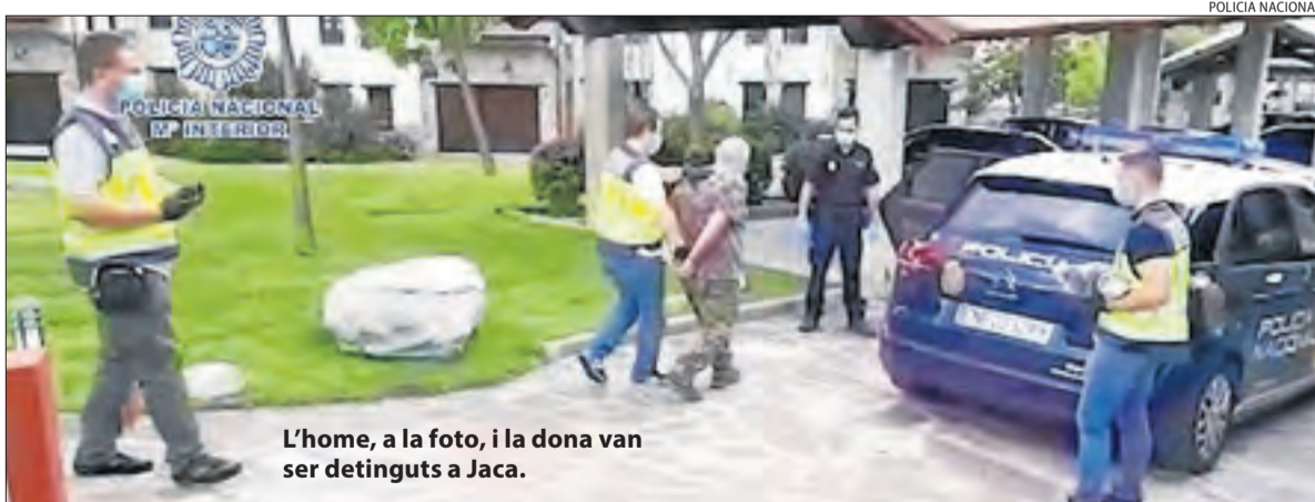
L'home, a la foto, i la dona van ser detinguts a Jaca.