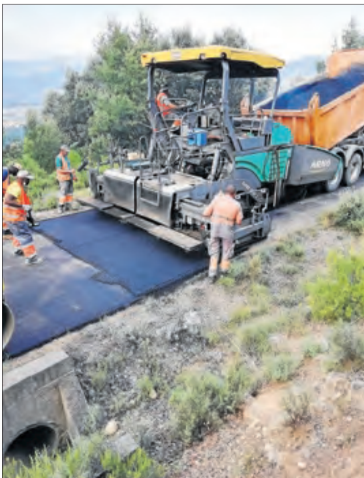
Les obres es van dur a terme aquesta setmana.

Les obres han estat molt reivindicades pels veïns atès el mal estat de la calçada