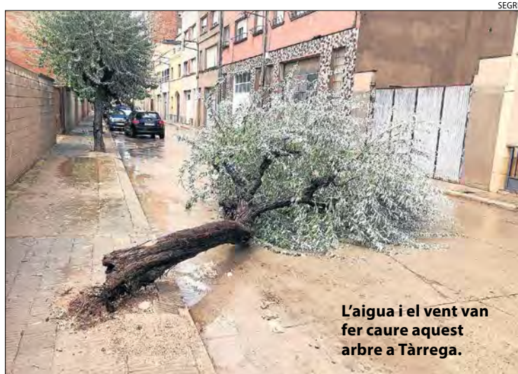
L'aigua i el vent van fer caure aquest arbre a Tàrrrega.

ÉS NOTÍCIA | 3-7 | LLEIDA | 10 | COMARQUES | 12 | PANORAMA | 16