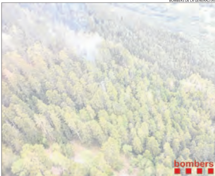
Un llamp va provocar diumenge un petit incendi a Arties.

amb 1.159 hectàrees de terreny forestal a la província. L'incendi més gran del 2019 va ser el que es va originar a la Ribera d'Ebre i que va afectar finques de les localitats lleidatanes de Maials, Bovera, Llardecans i la Granadella, la qual cosa va provocar que la massa forestal que va cremar l'any passat fos la més alta des de l'any 2009. D'altra banda, els Bombers van sufocar ahir un incendi de matolls a Rosselló.