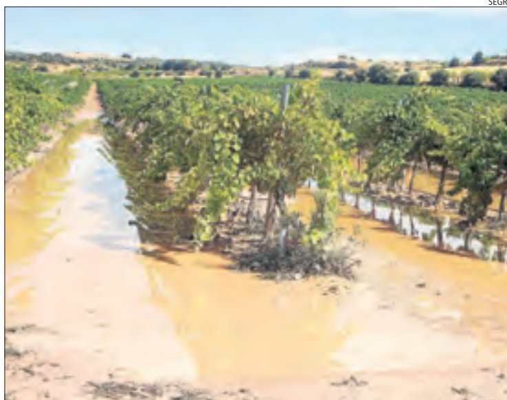
La tempesta va deixar diverses vinyes negades a Verdú.