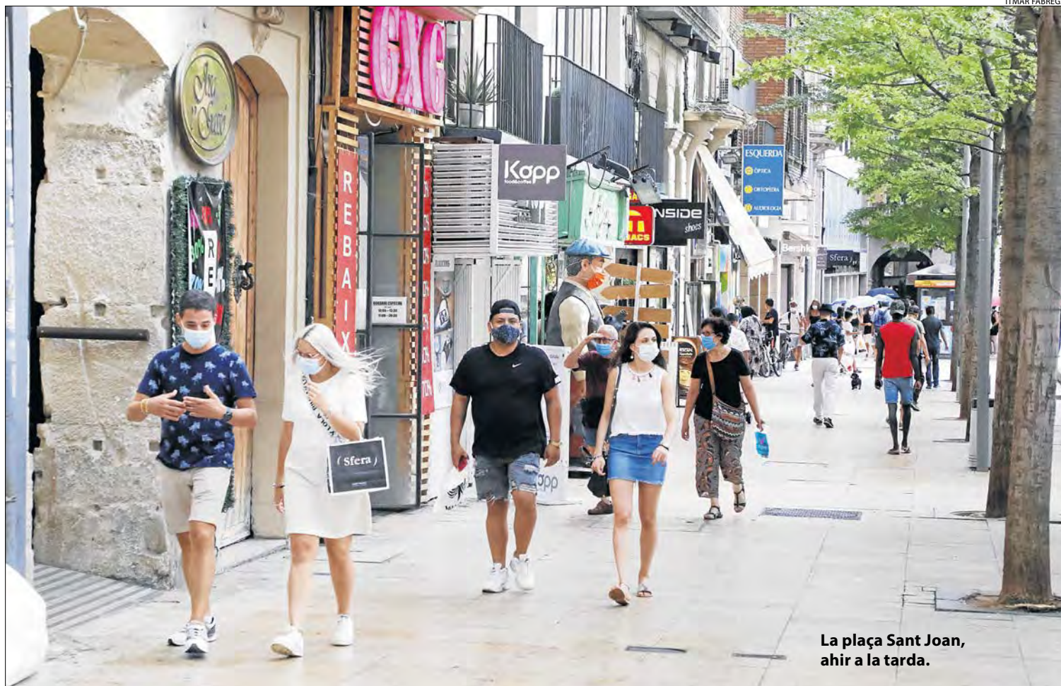
La plaça Sant Joan, ahir a la tarda.

Ajuntaments || El PSOE s'avé a renegociar el préstec del superàvit per fer front a la crisi sanitària