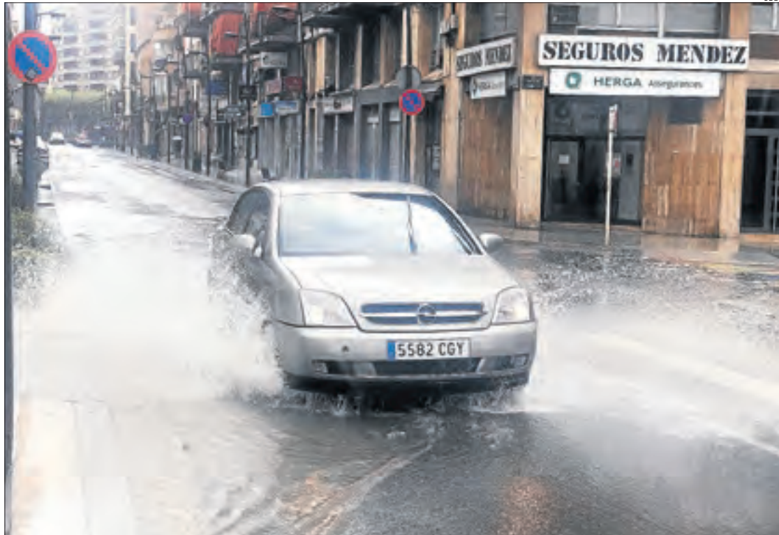
La pluja va fer acte de presència al migdia en algunes zona del pla. A la foto, un carrer de Tàrrega.