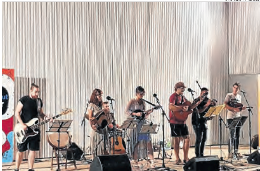
El grup Ksonronda va actuar dimarts en el marc del cicle 'Música i tapes'.