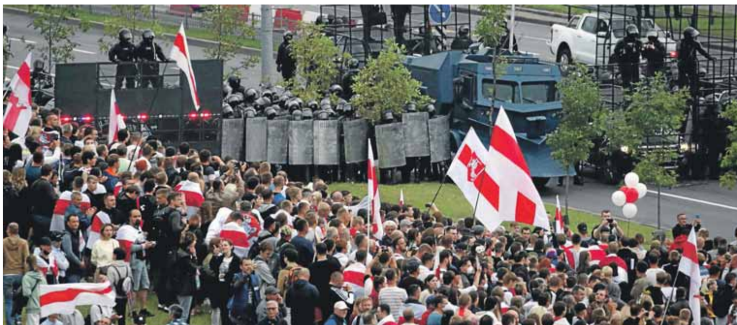
Forces policials i de l'exèrcit van vigilar el palau presidencial, però la manifestació va transcórrer sense incidents ■

Treball demana un subsidi per als pares que hagin de fer quarantena