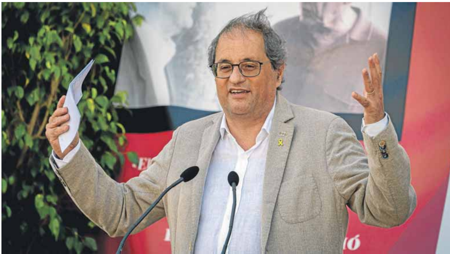
El president Quim Torra, durant la seva intervenció ahir en la cloenda de la 52a Universitat Catalana d'Estiu a Prada