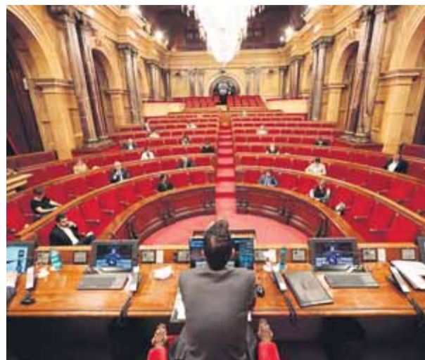
Els plens semipresencials han estat a l'ordre del dia ■ ACN

La pandèmia també ha fet que durant aquest pe-