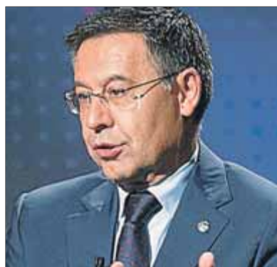
El president del Barça, Josep Maria Bartomeu

Bartomeu convoca una junta extraordinària d'urgència després de la vergonyant derrota a la Champions