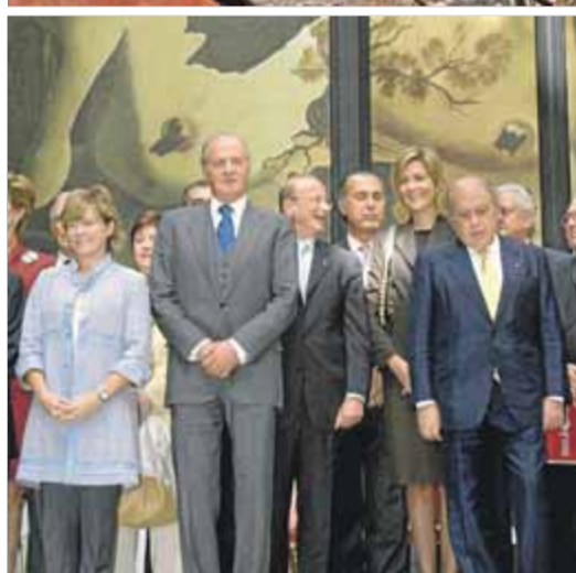
A l'esquerra, l'avinguda dedicada a l'emèrit a l'Hospitalet de Llobregat. Al costat, el bust que es va retirar a l'Ajuntament de Barcelona -amb polèmica inclosa- i, a sota, visita de Joan Carles I a Figueres l'any 2005

però que a l'Estat espanyol van passar desapercibudes. O el documental, gravat per la cadena britànica BBC el 1992, i en què es veu el llavors rei espanyol demanant ajuda per engegar una moto. "Digues al mecànic que vingui!", ordena Joan Carles, i quan el seu ajudant només ha de prémer un botó per posar en marxa la moto, protesta amb veu de desconcert: "Si jo he tocat aquí i no funcionava."