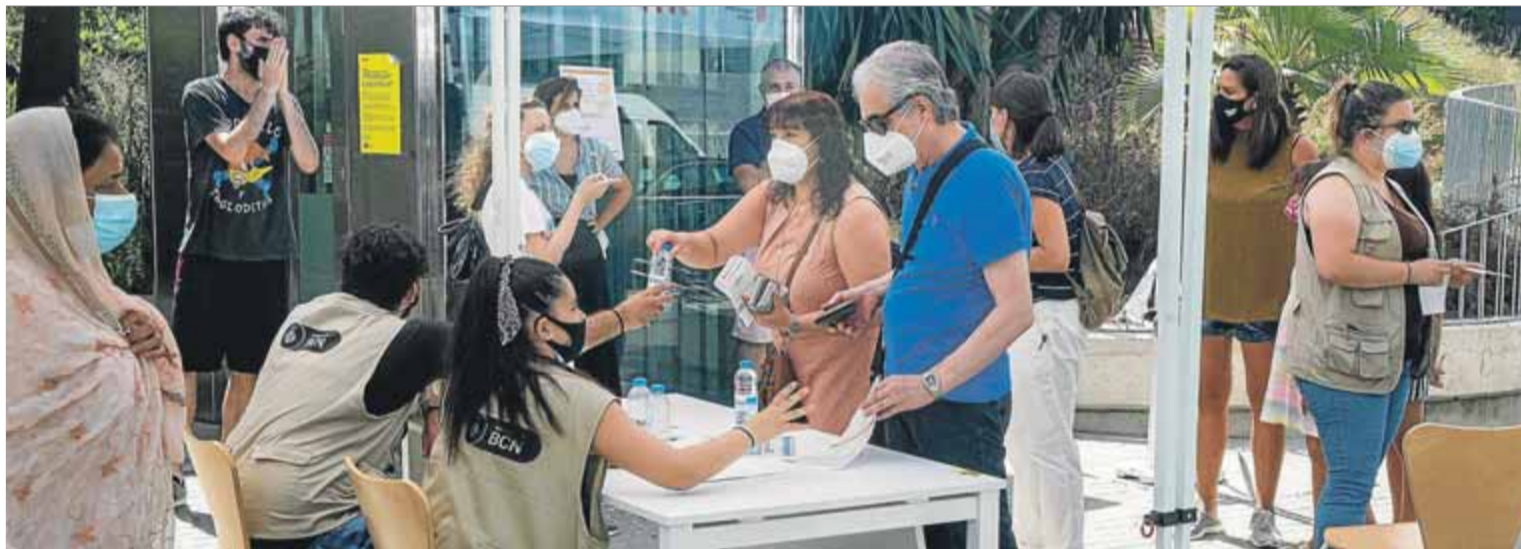
Veïns del barri de Torre Baró de Barcelona fent cua ahir al matí per poder-se fer els testos per detectar la Covid-19

A Catalunya hi ha hagut poca tradició a distingir el rei fugit