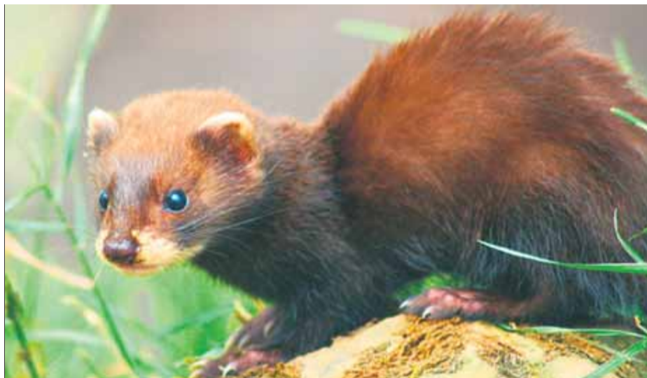
El turó europeu és una de les espècies que apareixen al catàleg

El catàleg divideix les espècies amenaçades en dues subcategories: "En perill", que inclou 85 espè-