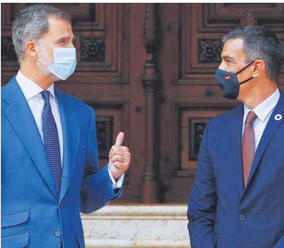
Felip VI rep, ahir, Sánchez al Palau de Marivent pel despatx estiuenc anual