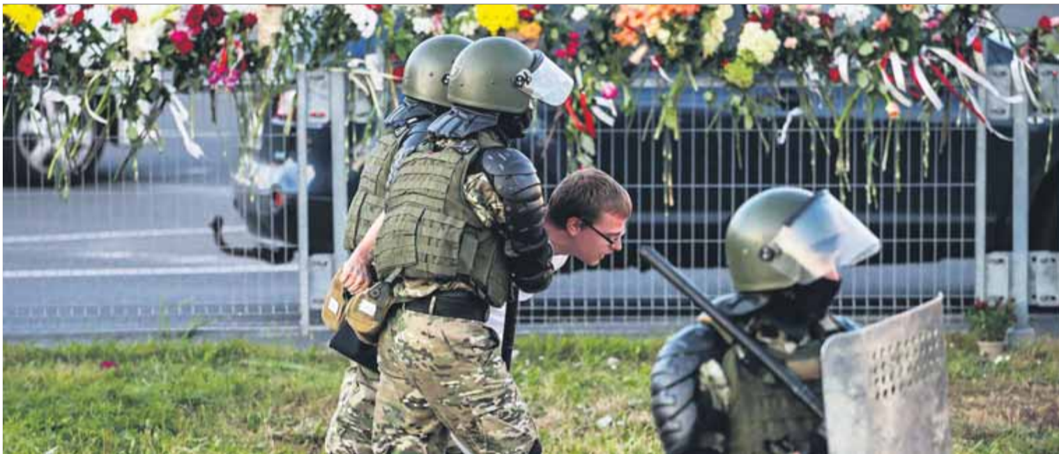
Membres de les forces militars especials bielorrusses detenen un manifestant durant les protestes a Minsk per frau electoral

631 residències tenen prohibides les visites i els ingressos Salut obliga a les restriccions encara que el risc sigui moderat