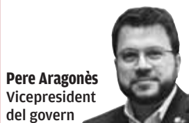
Pere Aragonès Vicepresident del govern

Europa, una economia al servei de la ciutadania