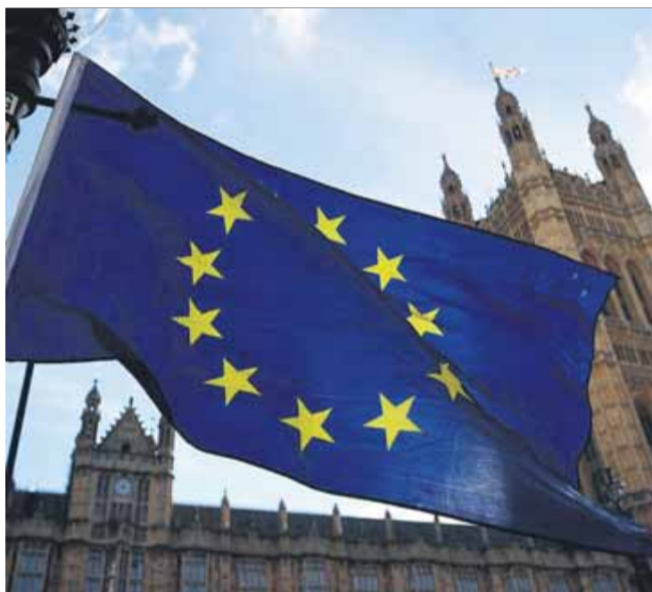
Una bandera europea, al centre de Londres

Les prioritats i objectius de la proposta europea coincideixen amb la voluntat de la Generalitat d'aprofitar la reconstrucció per impulsar l'economia per a la vida, la revolució verda, la digitalització plena i la societat del coneixement, per la qual cosa és imprescindible que puguem gestionar directament els 30.000 milions d'euros que corresponen a Catalunya. En aquest sentit, és impossible fer confiança a qui parla de cogovernar però es queda els fons europeus i no ens facilita els