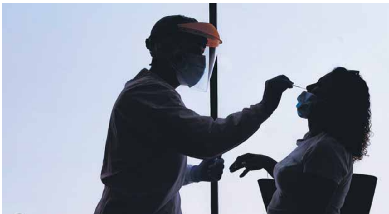
Un infermer, fent un test de coronavirus a una dona, diumenge passat a Saragossa

Quant al nombre total de morts, s'eleva a 12.837 persones després que les funeràries hagin reportat vuit defuncions en les darreres hores. La mitjana d'edat de positius per PCR és de 38 anys.