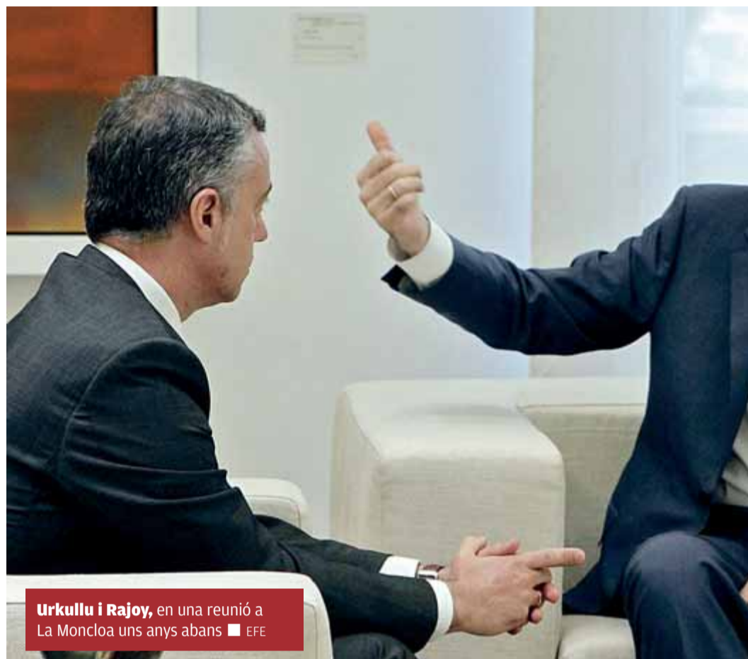
Urkullu i Rajoy, en una reunió a La Moncloa uns anys abans

Atentamente, un abrazo! Iñigo Urkullu Renteria. Lehendakari.