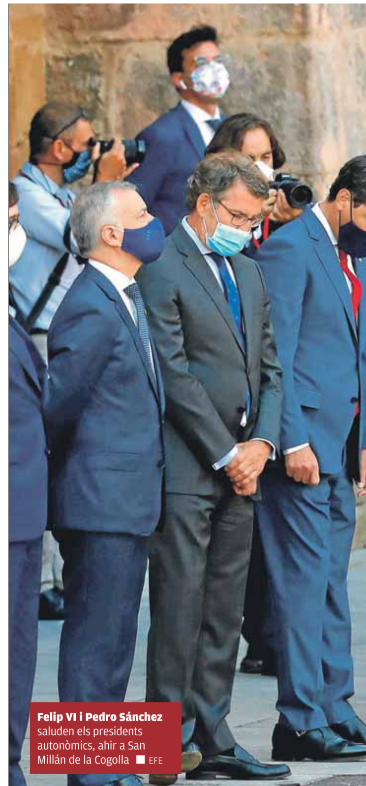
Felip VI i Pedro Sánchez saluden els presidents autonòmics, ahir a San Millán de la Cogolla

Sánchez va traslladar a tots els presents i a Torra que podrien començar a rebre prefinançament per un 10% dels fons la primavera del 2021 i que el sistema d'entrega –“facilitat de recuperació i resiliència”, ho anomena– funcionarà per “projectes alineats”