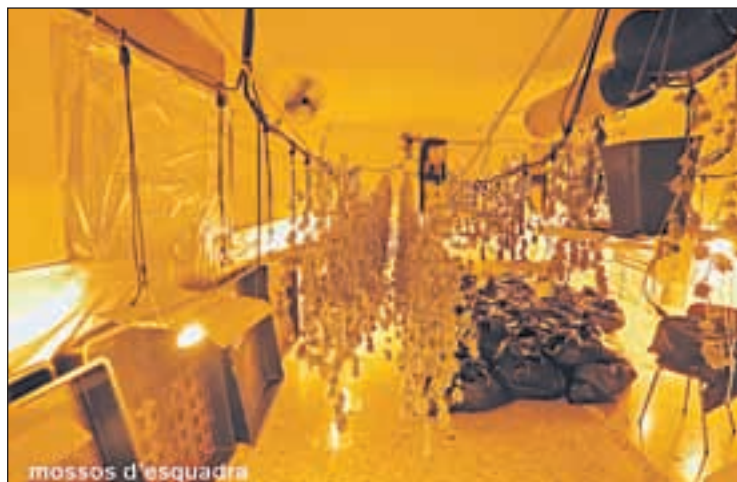
La plantació estava en procés d'assecat

Agents dels Mossos d'Esquadra van detenir dimecres a un home de 40 anys i veí de Vallfogona de Balaguer, com a presumpte autor d'un delictes contra la salut pública i d'un delictes de defraudació de fluid elèctric.