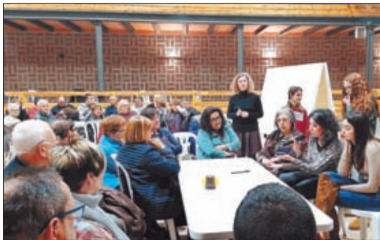
Reunió del Pla Estratègic abans de la pandèmia

De les primeres dades de les entrevistes realitzades al mes de febrer, se'n va poder extreure que els vilatans troben a faltar més serveis per a la gent gran, algun equipament que pugui atendre a un col·lectiu cada cop més nombros, i també la necessitat d'una nova escola, un equipament im-