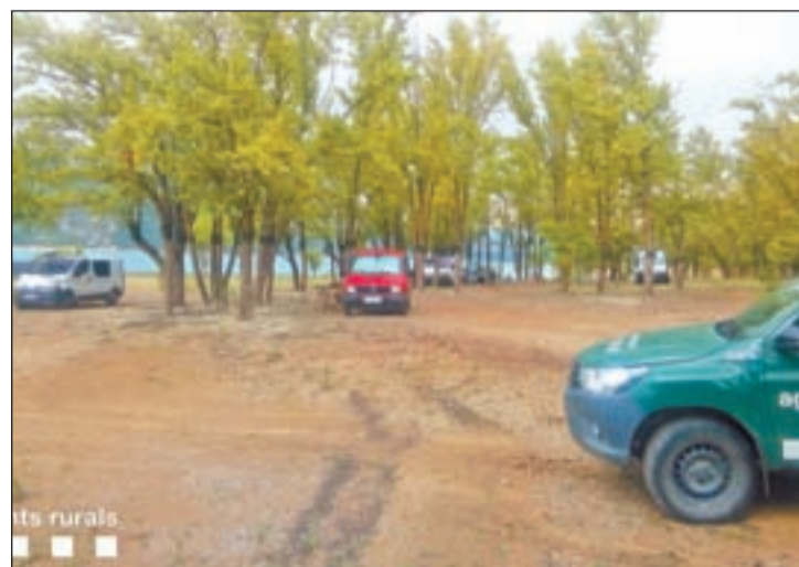
FOTO: Agents Rurals / Vehicles sancionats per circular camp a través

peratures. L'afectació del mildiu, tot i ser generalitzada, varia segons la zona de producció i també les varietats, amb més incidència en macabeus, merlots i ulls de llebre. A nivell global, s'esperen unes pèrdues al voltant del 20% de mitjana. La verema 2020 a les 11 DO catalanes està previst que s'allargui fins a finals d'octubre quan s'acabarà de veremar a més alçada.