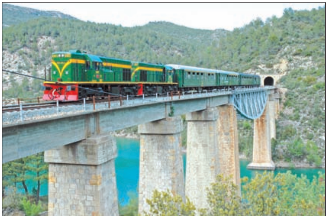
El trajecte turístic de 89 quilòmetres uneix la ciutat de Lleida amb la Pobla de Segur

El viatge transcorre per la dreta del riu Segre des de Lleida fins a Balaguer, per una via única en un itinerari planer fins a arribar a les primeres muralles muntanyoses de Sant Llorenç de Montgai i Camarasa. Després, el tren s'incorpora a la zona de la conca del riu Noguera Pallaresa fins arribar, entre embassaments i serralades com el Montsec, a la Pobla de Segur, la seva darrera destinació. En concret, el Tren dels Llacs circula-