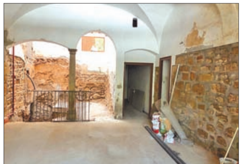
Imatge de la planta baixa de Cal Mas Vell

gona i tercera s'estan realitzant els acabats. Per tant, ja es pot començar la fase de les obres de la planta baixa. Concretament, aquesta última fase del projecte preveu la rehabilitació de la planta baixa i el pati interior de l'edifici per destinar-los i condicionar-los per a serveis complementaris que millorin la qualitat de vida dels usuaris de la residència.