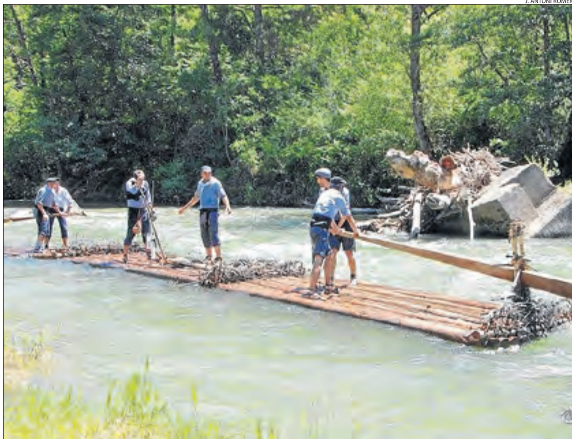
Els raiers baixant ahir el riu Noguera Pallaresa, una tradició que reviu aquest antic ofici.