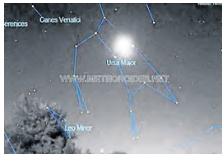
Imatge del bòlid que es va poder veure sobre Madrid i Toledo.

D'altra banda, una roca procedent d'un asteroide va