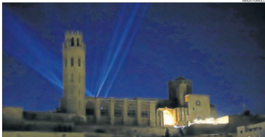
La Seu Vella va ocultar l'espectacle Iluminós, emmarcat dins del programa Fase Cultura.