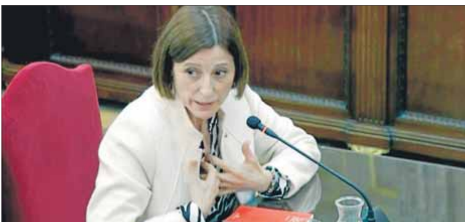
Carme Forcadell en la seva declaració davant del Suprem