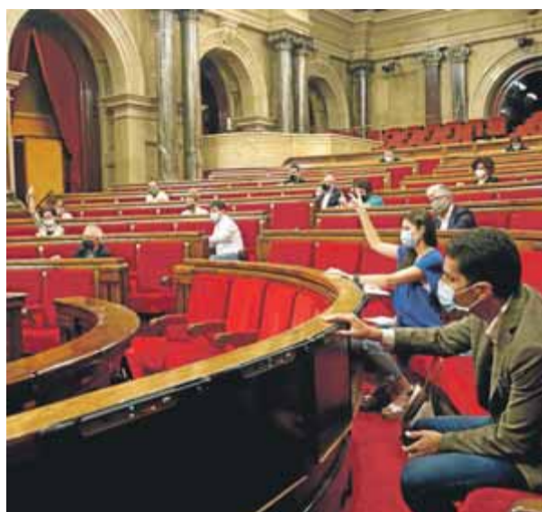
Un moment de les votacions d'ahir al Parlament