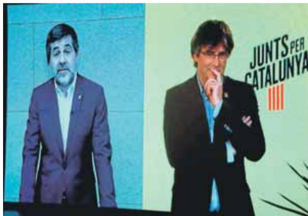
Sànchez i Puigdemont impulsen el nou partit