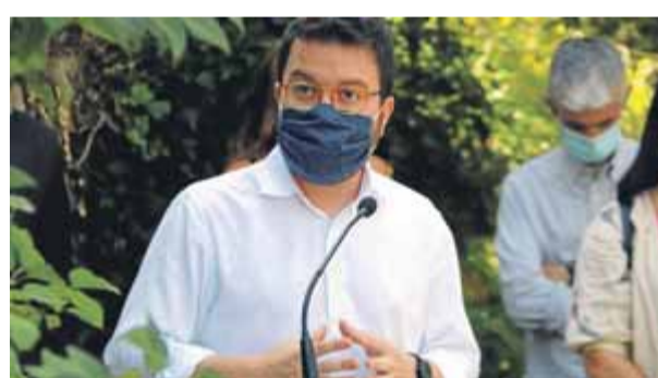
El vicepresident, ahir a Sant Vicenç de Castellet