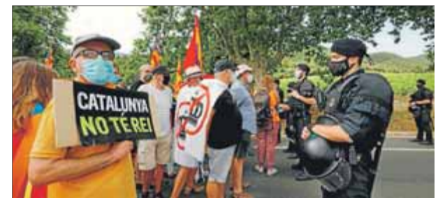
Agents dels Mossos durant la protesta a Poblet

L'aprovació, ahir, del dictamen de la comissió sobre el 155 al ple del Parlament va servir per escenificar una altra topada entre Cs, el PSC i el PP, per una banda, i l'independentisme, de l'altra, sobre els motius de la intervenció de l'autogovern i les conseqüències que això ha tingut. ■ REDACCIÓ