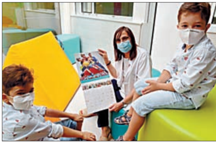
Pacients de l'hospital lleidatà, protagonistes del calendari