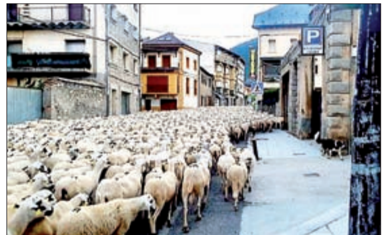
El ramat d'ovelles, al seu pas per la població de Vilaller

que hi ha el túnel nou creuen en camió o per la muntanya. No es vol tallar el trànsit i el túnel vell no és prou segur per fer-hi el pas. La trashumància a peu d'ovelles i vaques és cada vegada més escassa i des de ja fa molts anys la majoria de bestiar arriba en camions a les pastures altes de l'estiu. Quan comenci la tardor tornaran a baixar cap al Pla de Lleida per passar-hi els mesos d'hivern.