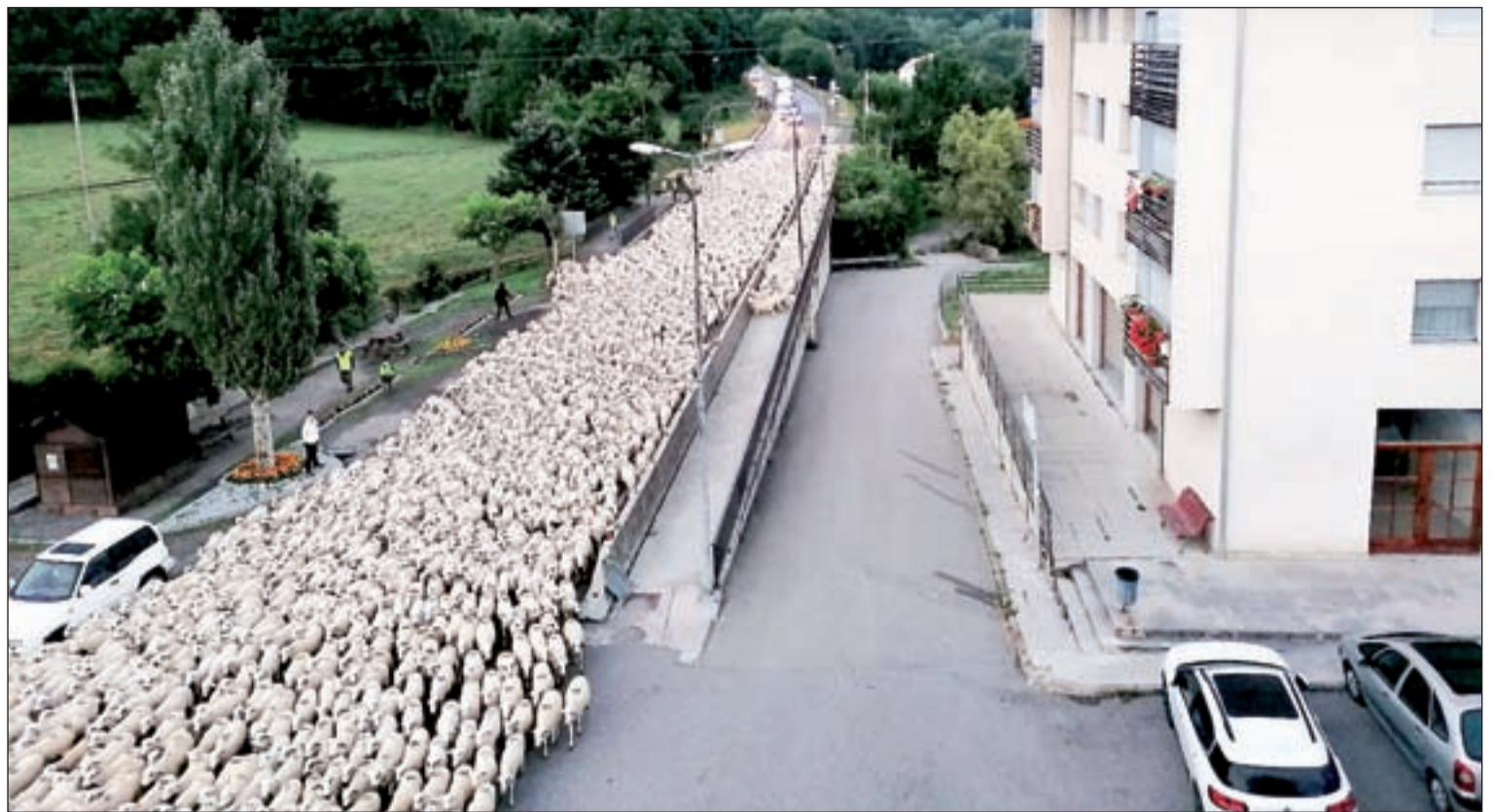
Els tres milers de caps de bestiar van passar ahir per l'Alta Ribagorça, on se'ls va unir un altre ramat procedent de Ginast

Compromís i els grups de l'oposició a la Seu d'Urgell van mostrar ahir la seva preocupació al detectar que "per l'equip de govern la construcció de la residència de la gent gran no sembla ser una prioritat". Compromís també es va oposar a la modificació de crèdit.