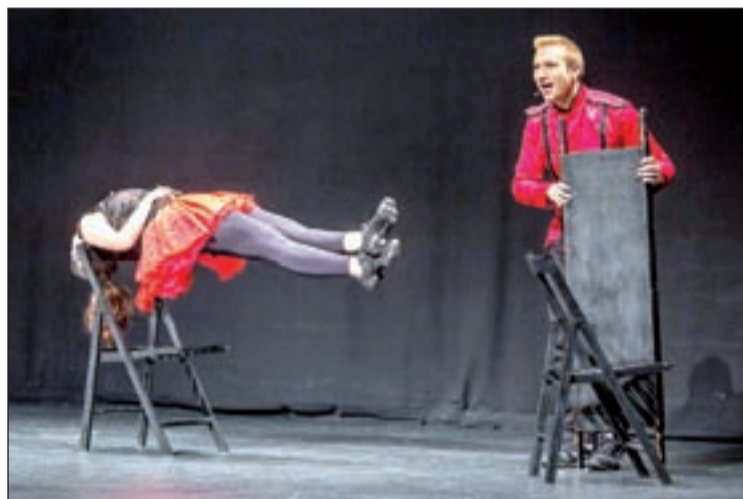
El ilusionista hace que su compañera flote en el aire

Una de sus características es que para todas esas acrobacias pide siempre la colaboración de