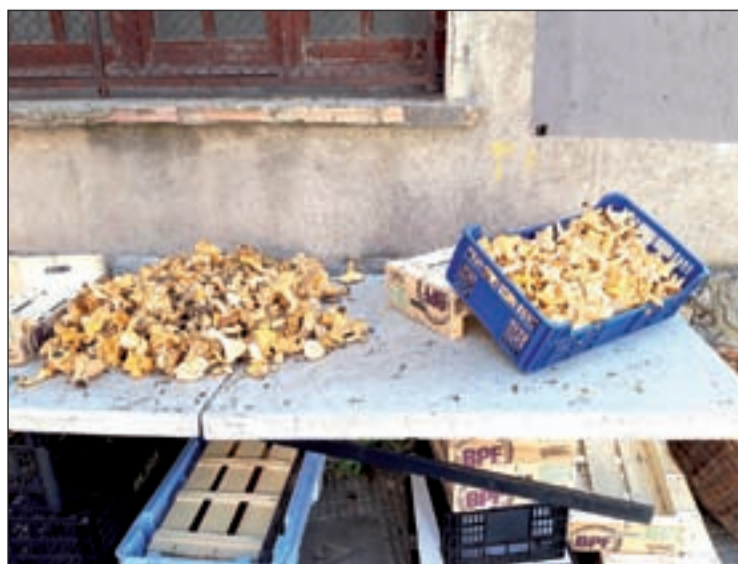
Les parades ja es veien ahir a l'Alta Ribagorça