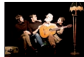
Dos pases para este espectáculo

La tercera entrega del ciclo de actuaciones 'Singul-Art' de Alpicat ofrece esta noche dos sesiones (21.30 y 22.30 horas) del montaje 'Otto', a cargo de Puppae Company que se desarrollará, con aforo limitado, en la plaza de la iglesia y no en su interior como en principio se había anunciado. 'Otto' es un espectáculo de teatro de títeres dirigido a todos los públicos con una duración aproximada de 20 minutos, donde la manipulación, la música en directo y el entorno propondrán al espectador un viaje a un imaginario del cual no querrán retornar. Muy recomendado para un público familiar.