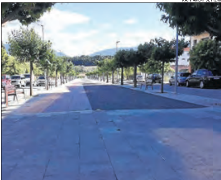
La rambla Pompeu Fabra de Tremp.