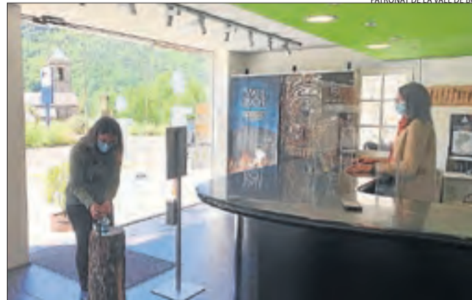
L'oficina de turisme de la Vall de Boí.