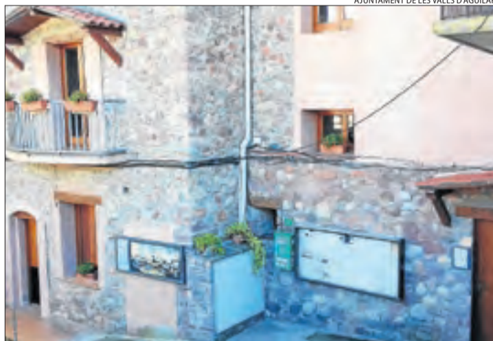
Edifici de l'ajuntament i del jutjat de pau.

Segons la primera edil es tracta d'una situació molt injusta que va provocar les queixes dels veïns del municipi, que funcionen amb connexió a internet sense banda ampla i amb poques prestacions. "Estem enfadats i no podem permetre que la Generalitat autoritzi portar la fibra al jutjat