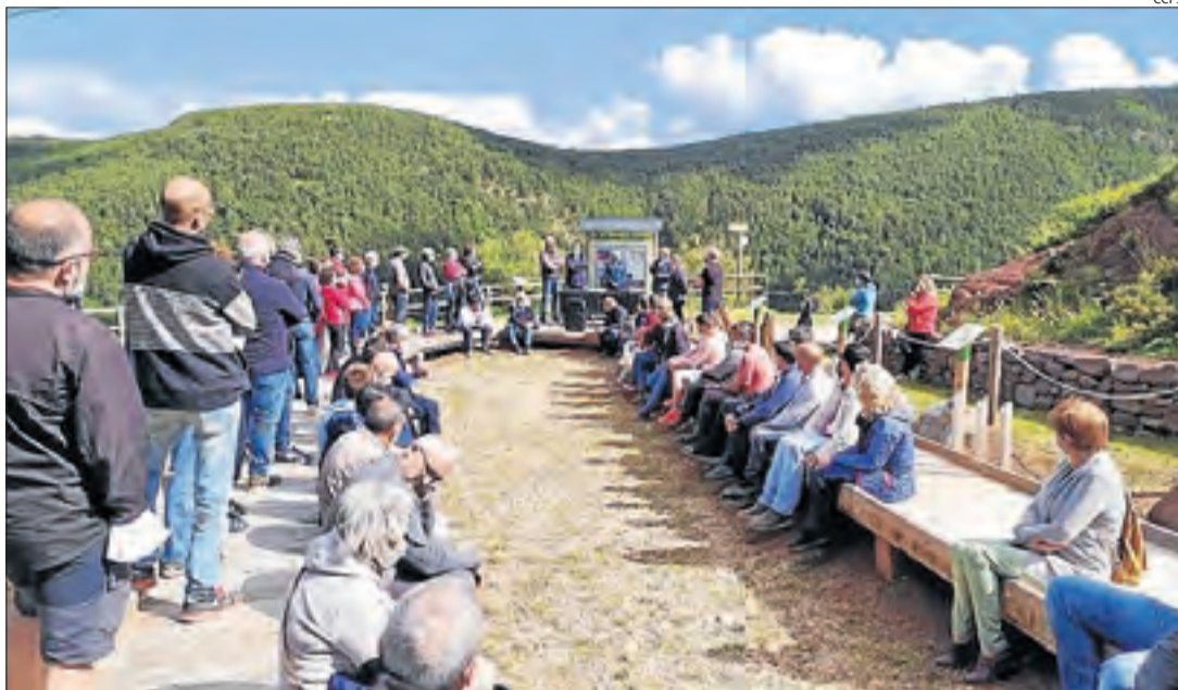
La reunió d'alcaldes, entitats i propietaris forestals al nucli de Rubió, a Soriguera.