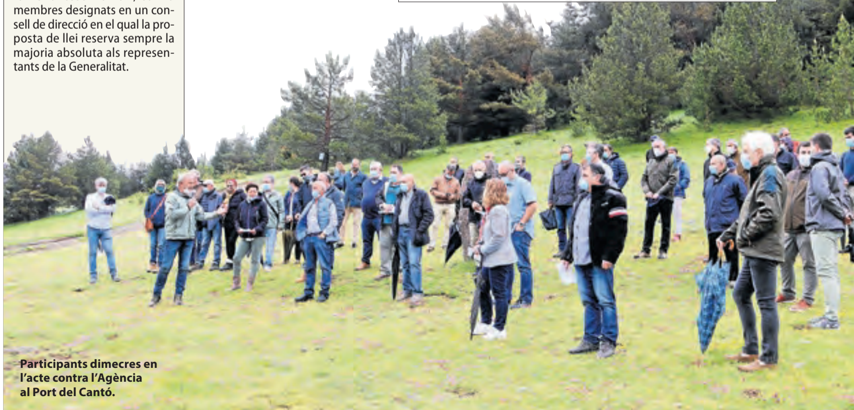
Participants dimecres en l'acte contra l'Agència al Port del Cantó.

Va anar a la protesta del Port del Cantó només com a alcaldessa d'Isona i Conca Dellà, al considerar que es deu "al municipi, els seus pobles i les persones que viuen de l'activitat agrària". Com a delegada del Govern, va dir, no ha rebut instruccions sobre la proposta del Parlament.