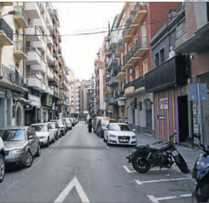
Entrar a la fase 3 dilluns que ve.