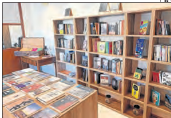
Imatge de l'interior d'aquest equipament a la Pobla.