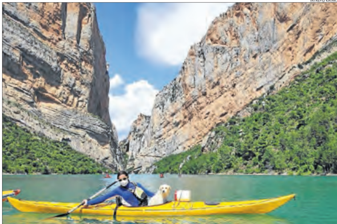
Els primers caiacs de la temporada al congost de Mont-rebei.