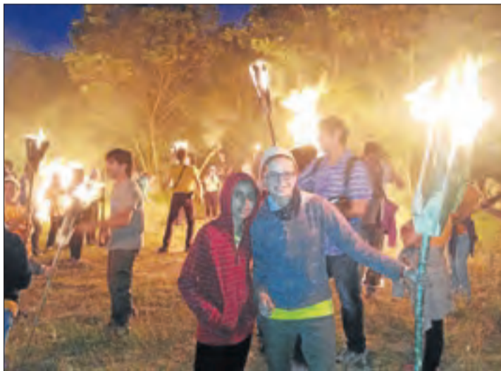
Imatge d'arxiu de la celebració de les falles al Pont.

Precisament, aquesta mateixa setmana els pobles de la Vall de Boí també van anunciar que no celebraran la tradicional baixada de falles ni cap de les activitats relacionades amb aquesta festa. Així, les baixades que han quedat suspeses són les de Boí, prevista per al