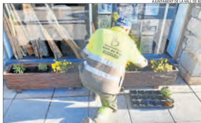
Aquesta setmana s'han arreglat les jardineres municipals.