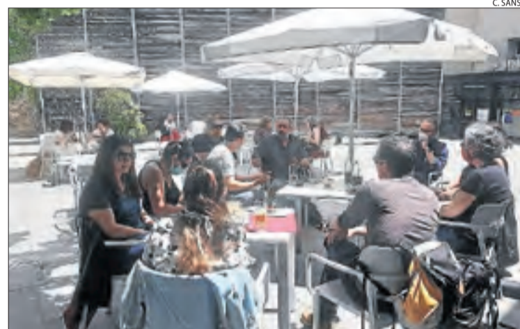
Una de les terrasses de la Seu d'Urgell plena de clients.

amb l'argument d'oferir-los una escapada després d'una primavera i una Setmana Santa que no han existit. Bonificacions al Túnel del Cadí, hotels de luxe al centre de Barcelona a preus més baixos de l'habitual i descomptes de fins al 30 per cent als sanitaris són algunes de les iniciatives del sector per salvar part de la facturació.