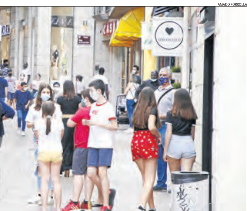
Ahir l'Eix Comercial.

total de places assegudes, per als transports amb autobús i ferroviaris, així com per als transports terrestres col·lectius d'àmbit urbà i periurbà. Això acaba amb la prescripció de deixar un seient buit entre dos viatgers. Pel que fa al transport privat, elimina els límits d'ocupació si els passatgers conviuen al domicili i el delimita a dos per fila en cas contrari.