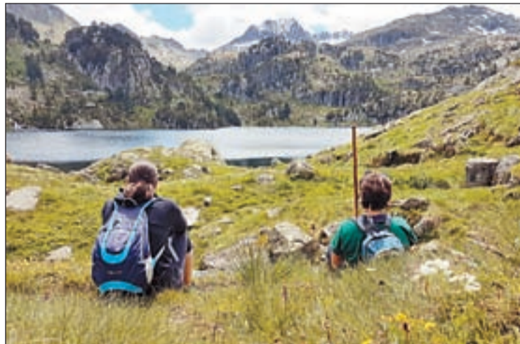
Dos excursionistes al llac de Colomers, al terme de Naut Aran

Aquests 50.000 euros se sumen a una altra ajuda de 200.000 euros aplicada pel consistori setmanes enrere amb la qual prete-