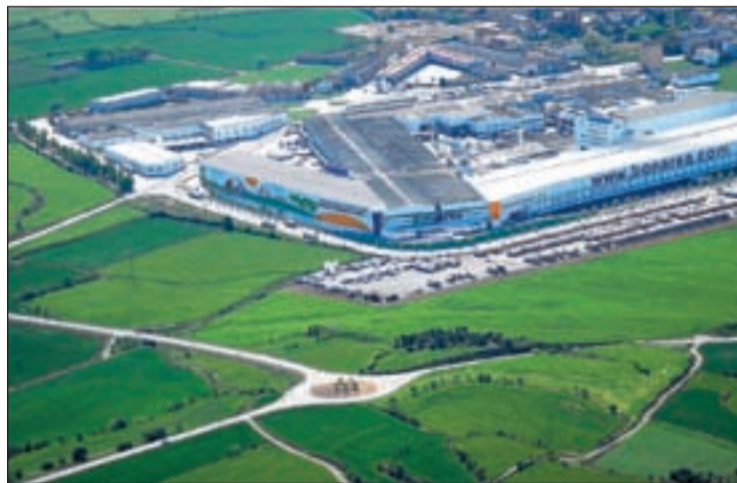
Vista del complex de bonÀrea Corporació a Guissona

Des de bonÀrea van indicar que "l'entitat ha crescut en totes les seves activitats i línies de negoci, tant en volum com en euros. Les bones xifres permeten un any més enfortir un model de negoci totalment integrat dins de l'àmbit rural, per arribar al client final sense cap intermediari". La Junta, per cinquè any consecutiu, també va acordar incrementar el dividend fins als 19 euros per acció (un 5,5% més que en l'anterior