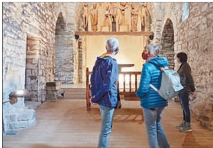
Pirmers visitans a l'església de Santa Eulàlia

L'església de Santa Eulàlia d'Erill la Vall va reobrir al públic i se suma així a les esglésies de Sant Climent de Taüll i Sant Joan de Boí. Les visites rebudes aquestes últimes setmanes provenen de la regió sanitària de l'Alt Pirineu i Aran i Andorra i ahir van rebre els primers visitants de Tarragona.