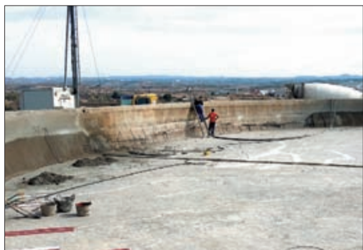
Imatge dels treballs de reparació del dipòsit

L'equip del Servei d'Assistència Tècnica (SAT) de la Segarra es compon de 4 persones que assessoren els ajuntaments en matèria juridicoadministrativa i economicofinancera. Recentment s'ha creat una borsa de treball per cobrir vacants i substitucions, on han participat una vintena de persones.