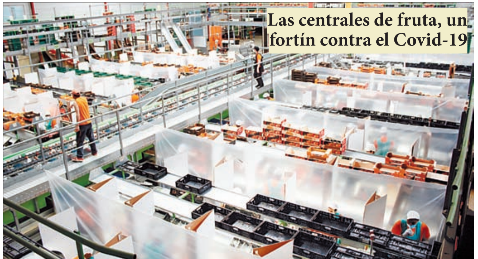
Las centrales de fruta, un fortín contra el Covid-19

► Celaá propone que las escuelas hagan algunas clases al aire libre