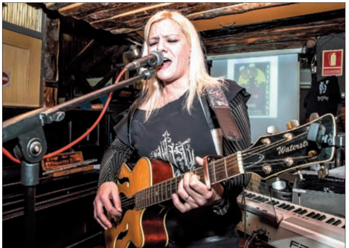
La pianista y cantante también recrea algunas canciones acompañada por la guitarra

Poco antes de su comparecencia en el festival germano, Dway-