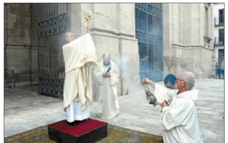
Moment del Corpus celebrat a la Catedral de Lleida

va ser concelebrada per una vintena de preveres, membres del Capítol Catedral, així com rectors i mossens de la ciutat. El bisbe va iniciar la seva homilia fent referència a la situació actual i tot seguit va tenir paraules de record pels difunts que han estat víctimes de la pandèmia, pels seus familiars i pels malats i tots els que cuiden d'ells. Finalitzada la celebració es va fer la processó eucarística per l'interior de les naus de la Catedral, un fet que no es produïa des dels anys de la república. Ahir també es va celebrar el dia de la Caritat i de suport a l'acció social.