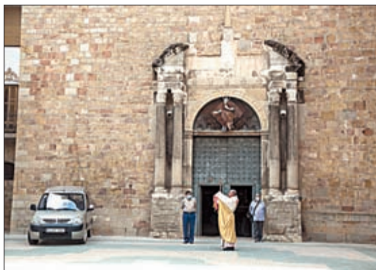
Només dos feligresos amb mascareta van estar presents

El Corpus Christi es va celebrar ahir a la localitat de Tremp amb una imatge insòlita en la localitat, ja que el mossèn de la localitat va fer la benedicció sense públic, arran de la pandèmia originada per la covid-19. En aquest sentit, cal indicar que només dos feligresos van estar presents en aquest acte i portaven posada la corresponent mascareta.