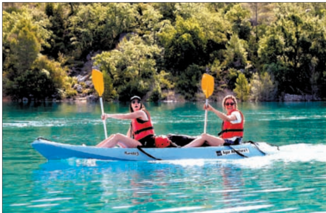
Les empreses d'esports d'aventura estan centrant els seus esforços en atreure al turisme interior

L'empresa d'activitats d'aventura Montsec Activa va reprendre l'activitat de caiac el passat 5 de juny, tot i que la mala previsió meteorològica va fer que la demanda fos baixa. Per aquest mateix motiu, els responsables d'Àger Aventura't van decidir no engegar de nou fins aquesta setmana, quan el nombre de reser-