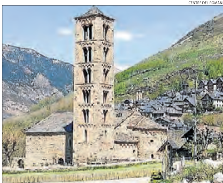
L'església romànica de Sant Climent de Taüll.

Així doncs, no podrà visitar-se la següent església fins que no s'hagi verificat durant quatre dies seguits el bon funcionament de les mesures implementades a Sant Climent. L'objectiu és que tothom pugui