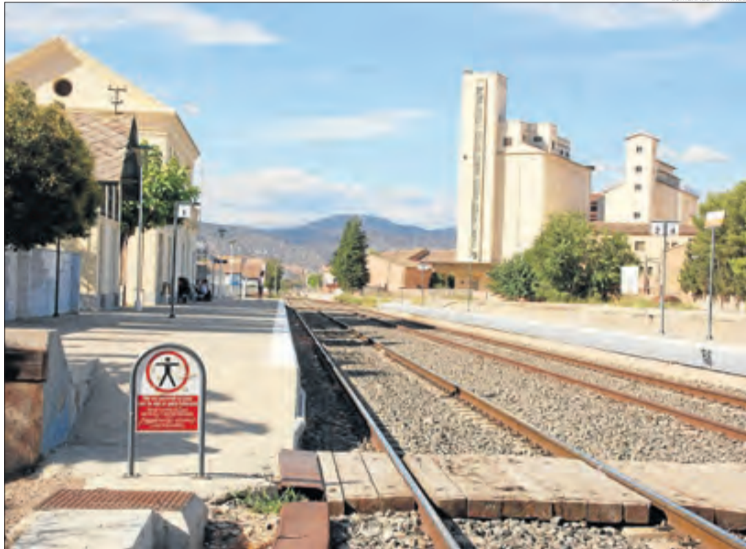
Imatge d'arxiu de l'estació de tren de Balaguer.