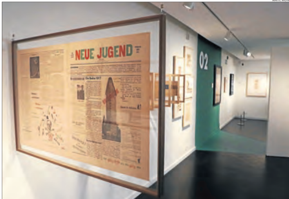
Una de les peces que es podran veure durant el recorregut del CaixaForum de Lleida a partir de dilluns.

L'exposició consta d'un total de 145 peces d'aquesta etapa de fotografia, pintura, collage i escultura