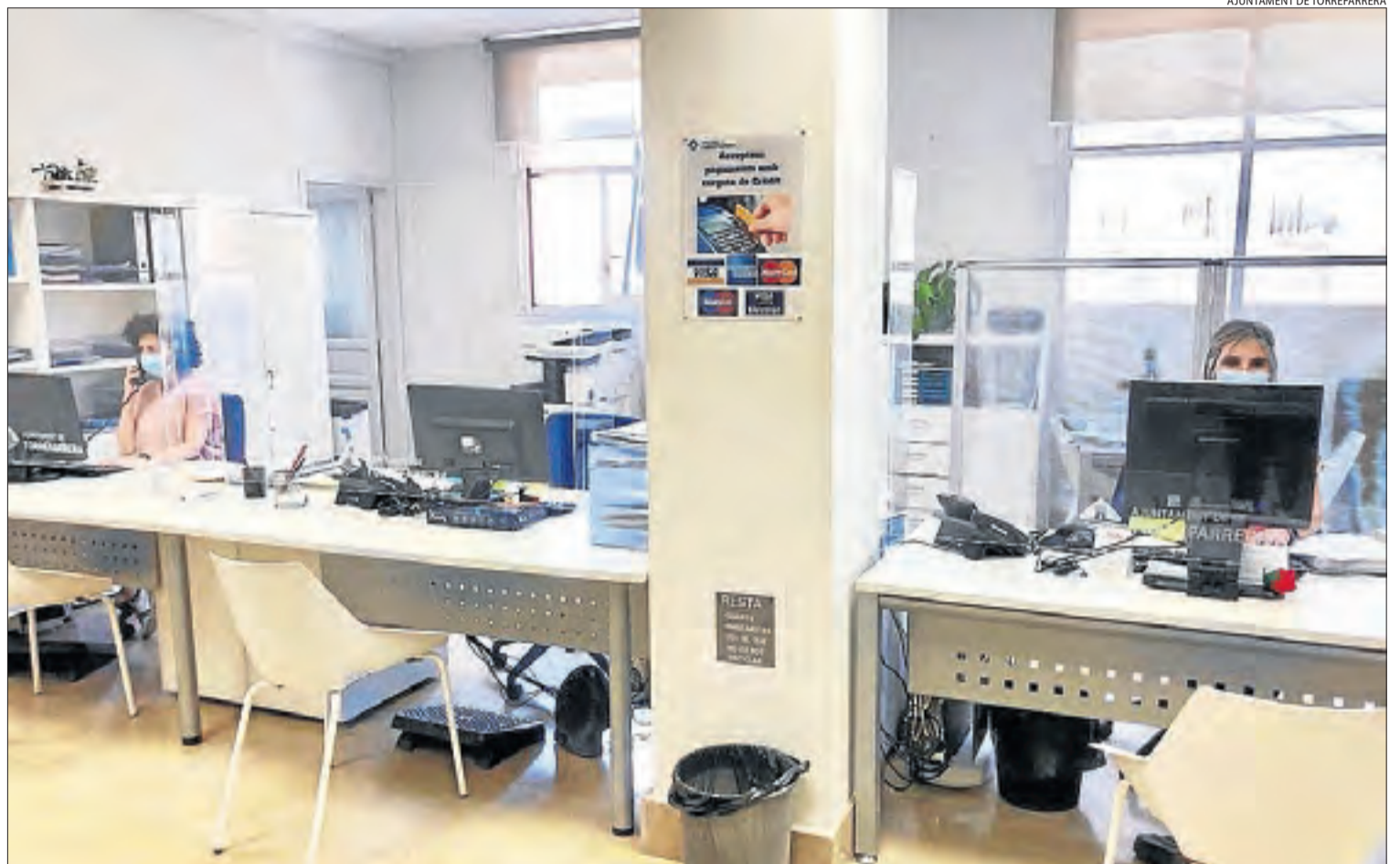
AJUNTAMENT DE TORREFARRERA

Així mateix, amb l'entrada a la fase 0 de la desescalada de l'estat d'alarma, l'ajuntament de Torrefarrera va incorporar la cita prèvia per atendre els seus veïns, una cosa que ja feien abans per a casos excepci-