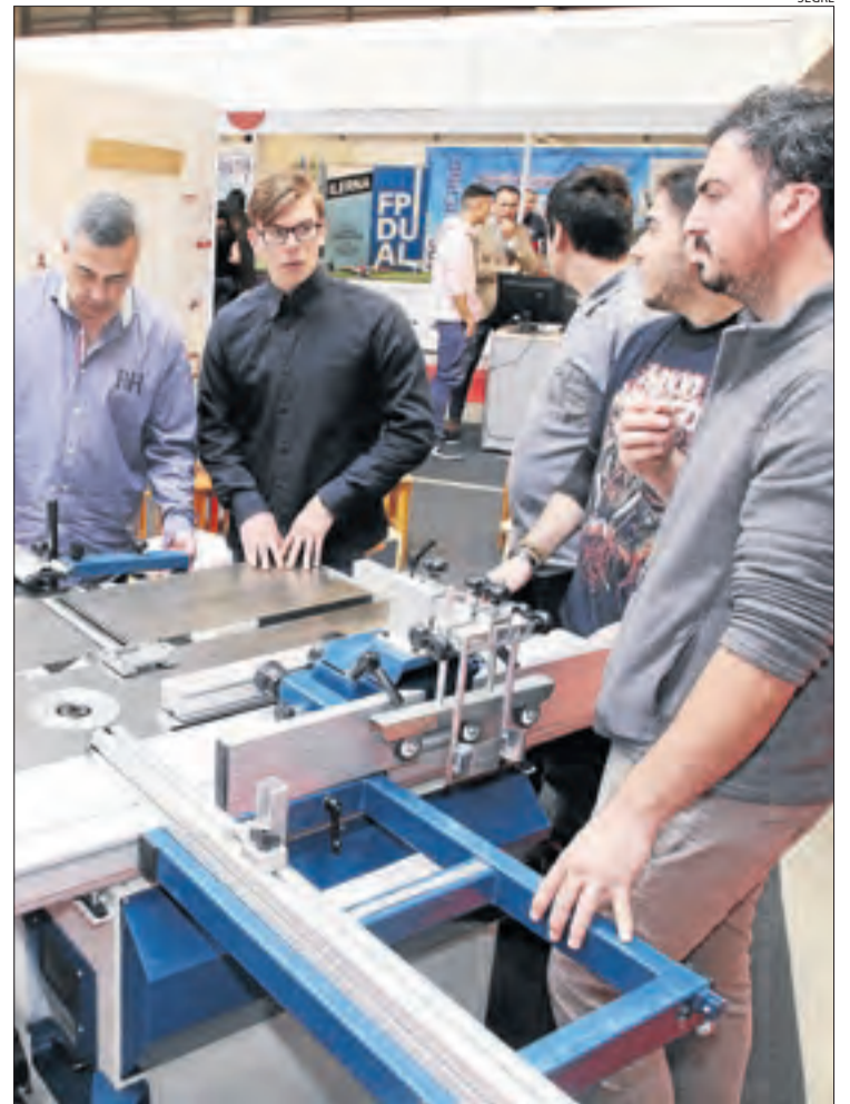
L'informe fa palès com s'incrementa la inserció en 14 de 23 famílies.

(Cervera), Ins Tremp, la Salle Mollerussa), Acser (Balaguer) i Francesc Ribalta (Solsona). Quant a Electricitat i electrònica (62,87%), es pot estudiar a l'Escola del Treball, Caparrella o Episcopal (Lleida), la Salle de Mollerussa i la Seu d'Urgell, IES Tremp i Institut Josep Vallverdú (les Borges). Hoteleria i turisme (61,10%), es cursen a l'Institut Hoteleria Lleida, Les, Ilerna i Hug Roger III (Sort). Gaudeixen també d'un elevat índex d'inserció (un 54%) els cicles de la família agrària, ben vinculats al territori. S'imparteixen a escoles agràries així com els IES del Pont i Mollerussa.