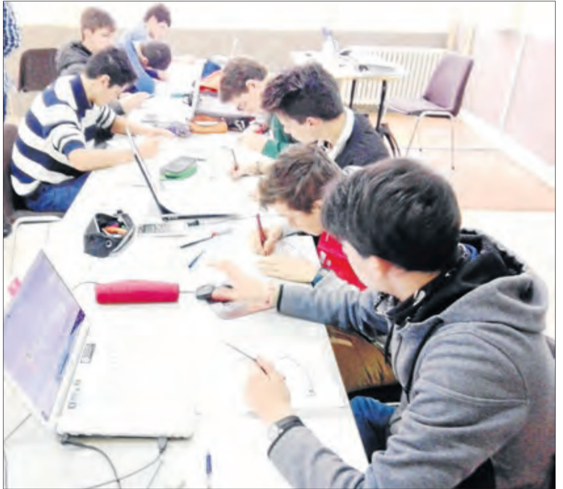
En FP, si hi ha més oferta que demanda, aplicaran el criteri de prioritat.

Prima el tràmit telemàtic i s'adapta per ser visualitzat en dispositius mòbils