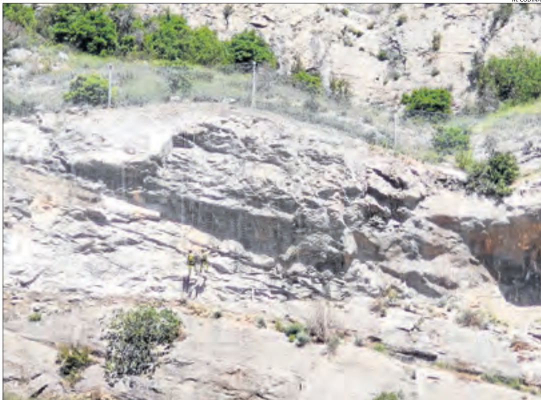
Imatge d'obres als talussos de la línia de la Pobla a mitjans d'aquest mes.