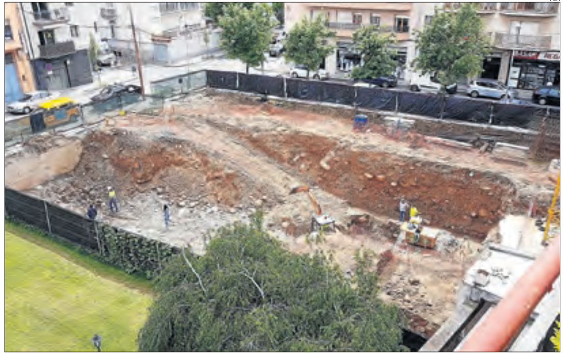
El nou CAP de la Seu d'Urgell estarà situat al costat del passeig Joan Brudieu.