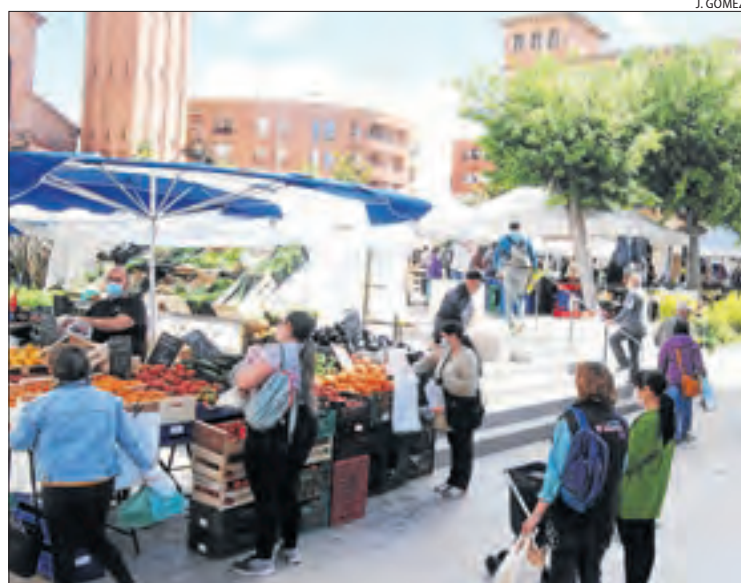
Imatge d'ahir del mercat de Mollerussa.

En total, van participar-hi 25 estands de productes frescos, alimentació i també viviers, que es van repartir per les places de l'Ajuntament, Manuel Bertrand