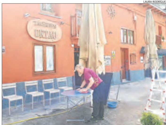
Una terrassa d'Arties preparant-se fa set dies per reobrir.