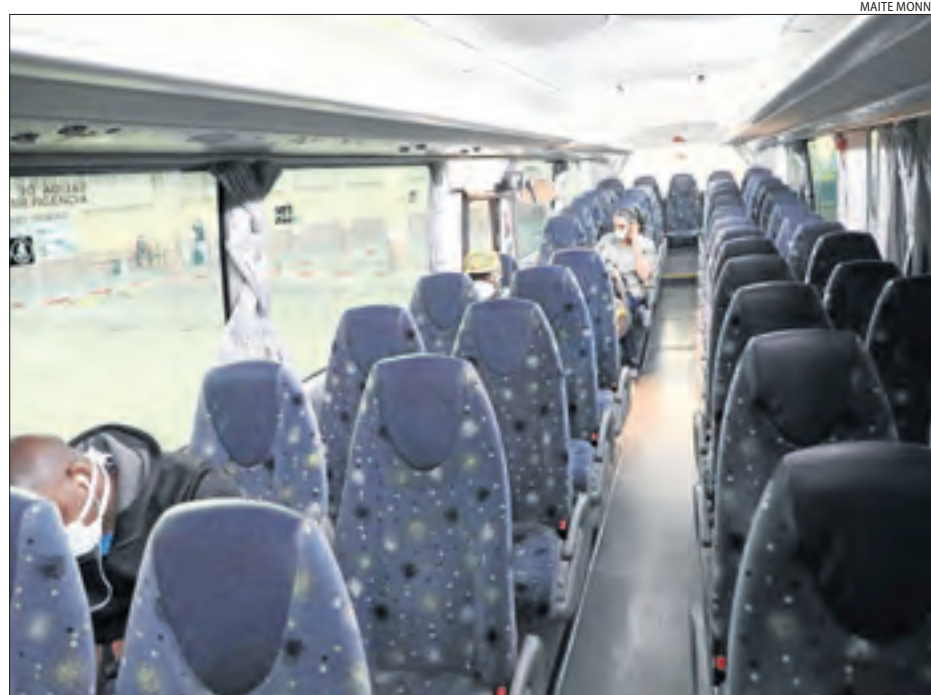
Imatge d'ahir d'usuaris de l'autocar que uneix Lleida i Albesa.

X. RODRÍGUEZ / H. CULLERÉ | LLEIDA | La demanda de transport públic a Lleida ha caigut fins més d'un 90% per la crisi sanitària del coronavirus. Fonts de Renfe van explicar ahir que en les línies de tren de Lleida a Barcelona per Manresa (R-12) i per la costa (R-13 i R-14) l'ocupació "és inferior al 10%" i van assegurar que l'oferta de trens regionals és actualment del 50%.