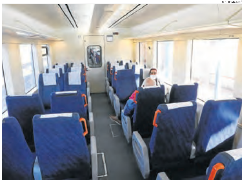
Passatgers al tren de la línia de la costa, ahir a l'estació de les Borges Blanques.

A les comarques del pla es preveu oferir més del 50% del servei d'autocars interurbans i al Pirineu, entre el 80% i el 100% || El tren de la Pobla només va rebre ahir 33 passatgers en hora punta