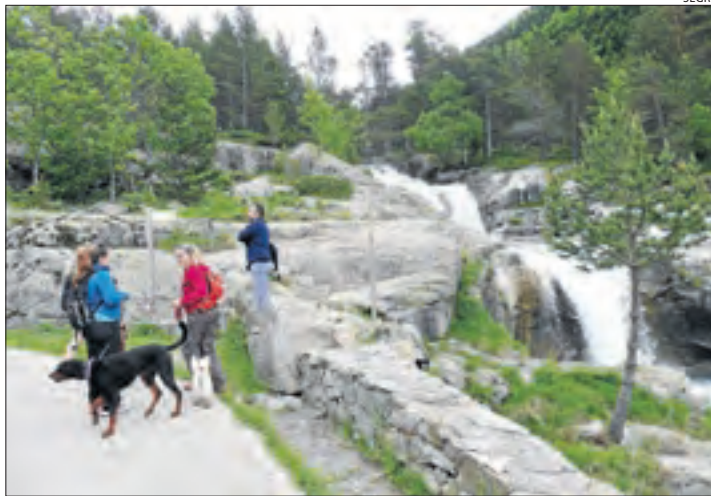
Imatge d'arxiu de turistes al parc d'Aigüestortes.

El consell d'alcaldes del Sobirà va aprovar ahir sol·licitar al Govern de la Generalitat ajornar la llei de creació de l'Agència del Patrimoni Natural i Biodiversitat de Catalunya al considerar que el territori ha quedat exclòs de la proposició de llei, que es preveu que s'aprovi en els propers mesos. Al text, demanen la paralització de la llei de creació de l'agència perquè es contempli la participació de tots els actors del territori. Tanmateix, la votació no va quedar exempta de polèmica perquè sis alcaldes de la comarca van votar en contra de la petició i dos més es van abstenir. La petició de presentar aquest escrit va tirar endavant amb set vots a favor. Alguns alcaldes van manifestar que no saben com afectarà aquesta agència el territori i