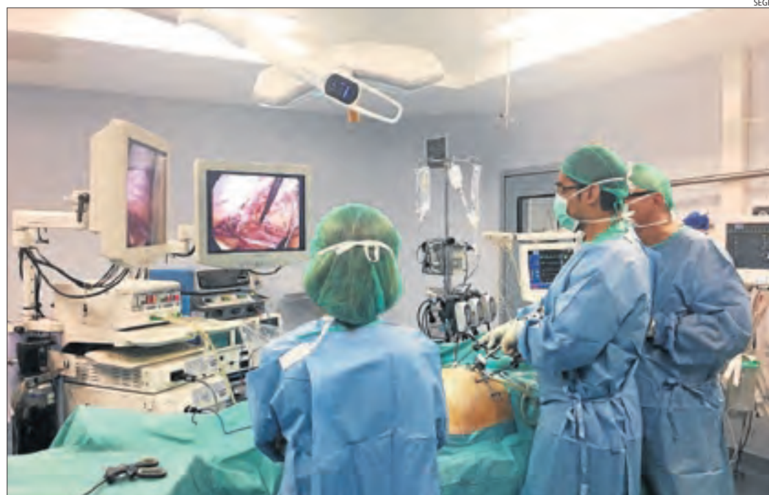
Imatge d'arxiu d'una intervenció quirúrgica a l'hospital Arnau de Vilanova.

Durant els mesos de març i abril a l'Arnau i el Santa Maria || Salut vol dur a terme les d'aquelles patologies greus ajornades abans del mes d'agost