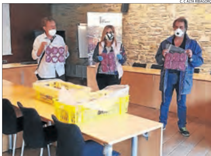
Entrega de la carn al banc d'aliments de l'Alta Ribagorça.

de lloguer, llum, gas i altres serveis bàsics per a les famílies més vulnerables, més afectades per la pandèmia del Covid-19. D'altra banda, l'ajuntament de Vilaller no cobrarà aquest any la taxa de terrasses a bars i restaurants i permetrà ampliar la superfície a aquests establiments per suportar millor la reobertura.