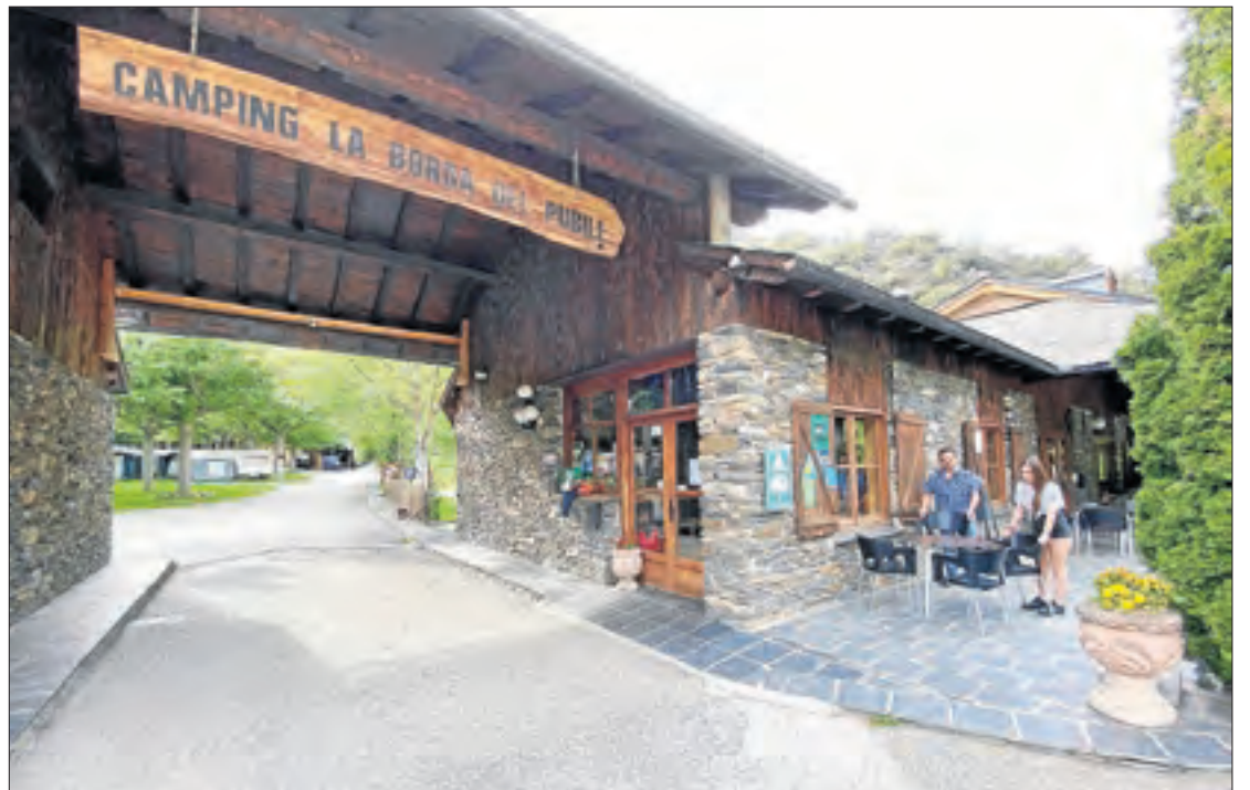
El càmping La Borda del Pubill, a Ribera de Cardós, es preparava ahir per obrir demà.

Vetllatoris i enterraments: En els vetllatoris, eleva l'afluència a deu persones en espais tancats o quinze en oberts. Als enterraments, seran fins a quinze persones.