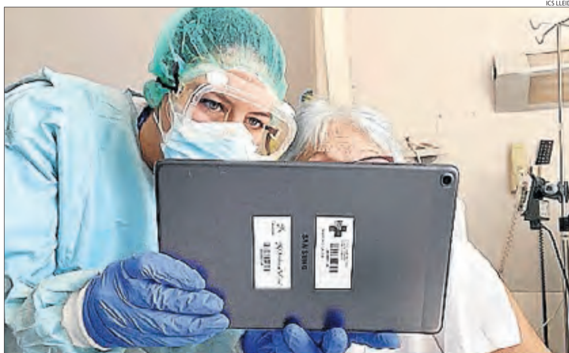
Una pacient ingressada a l'Arnau en una videotrucada amb els familiars.

■ La corba del coronavirus a Espanya va dibuixar ahir una nova pujada tant del nombre de morts, que amb 229 sumen un total de 26.299, com del d'infectats confirmats, que van ser 1.095, amb la qual cosa ja són 222.857 els casos. Els nous contagis es van incrementar així per segon dia consecutiu i van superar els 1.000, una cosa que no passava des del 2 de maig.