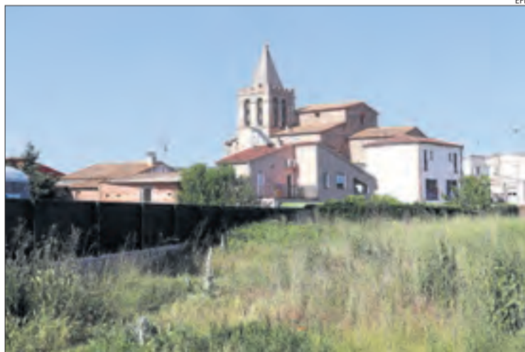
Vistes de Riudarenes, epicentre del sisme d'ahir.

Segons va informar l'Institut Cartogràfic i Geològic, en els