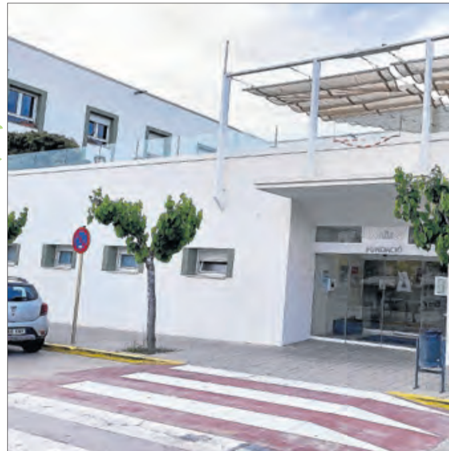
Imatge d'ahir de l'entrada al CAP de Guissona.

Per a l'alcalde de Preixana, Jaume Pané, "totes les mesures de prevenció són bones encara que no haurien de posar al mateix sac Lleida ciutat i els pobles petits". Per la seua