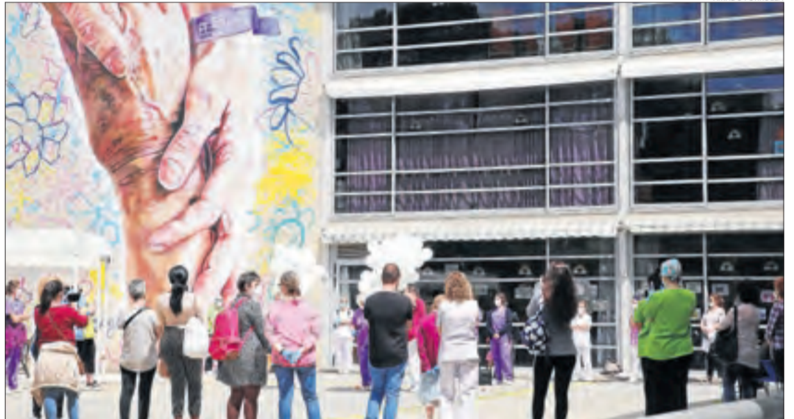
Personal de la Llar de Sant Josep durant l'acte d'homenatge celebrat dijous passat.

LLEIDA | El Tribunal Superior de Justícia de Catalunya (TSJC) ha ordenat a la conselleria de Salut i al CatSalut donar material de protecció i fer tests de coronavirus "a tots els cuidadors de residències de persones grans de Catalunya". En una interlocutòria firmada dilluns, els magistrats estimen en part les mesures cautelarríssimes que va demanar el sindicat Usoc, i requereix que s'entreguin de forma urgent bates impermeables, mascaretes, ulleres de protecció i guants a tot el personal. El sindicat va reclamar que el tribunal establís un període de vint-i-quatre hores per entregar el material i començar a fer tests, una cosa que el TSJC sí que ha estimat en altres ocasions, però que aquesta vegada ha deixat fora de l'acord. Els magistrats es refereixen a la seua argumentació a acords similars que ha pres el tribunal per a metges i personal d'ambulàncies, i assenyalen la "singular protecció de les residències per a la tercera edat",