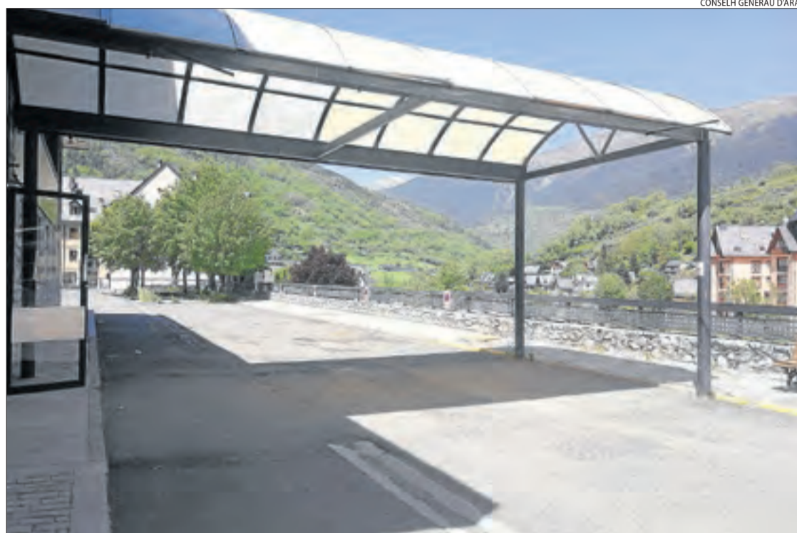
El lloc on estava muntat l'hospital de campanya de Vielha.

Segons Salut, el Sobirà és l'única comarca de Lleida que encara no ha registrat morts per coronavirus