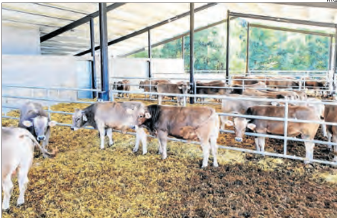
Els animals del centre de testatge de Bellestar que van ser subhastats ahir.

Els ramaders interessats havien rebut fitxes amb fotografies dels dotze exemplars que van sortir a subhasta, una descripció de cada un dels animals i els respectius preus de sortida, que oscil·laven entre els 1.400