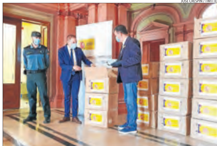
Imatge de l'entrega de mascaretes a la Diputació.

Aquestes 65.000 mascaretes es destinaran a treballadors municipals i a col·lectius vulnerables de Lleida i arriben després de l'anunci del Govern de l'obligatorietat d'utilitzar-les al transport públic. En total, a