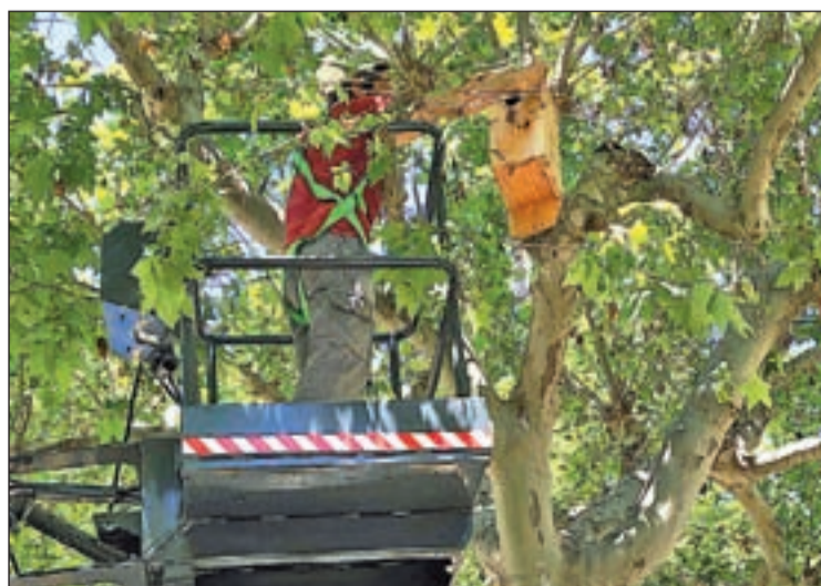
La brigada municipal va començar ahir a posar-los

La brigada municipal de Solsona ha col·locat una dotzena de caixes niu per a ocells i ratpenats al nucli urbà de la localitat. És una iniciativa de les regidories de Parcs i Jardins i Medi Ambient que, entre altres objectius, busca controlar de forma natural i ecològica diverses plagues que afecten la biodiversitat i generen molèsties als veïns.