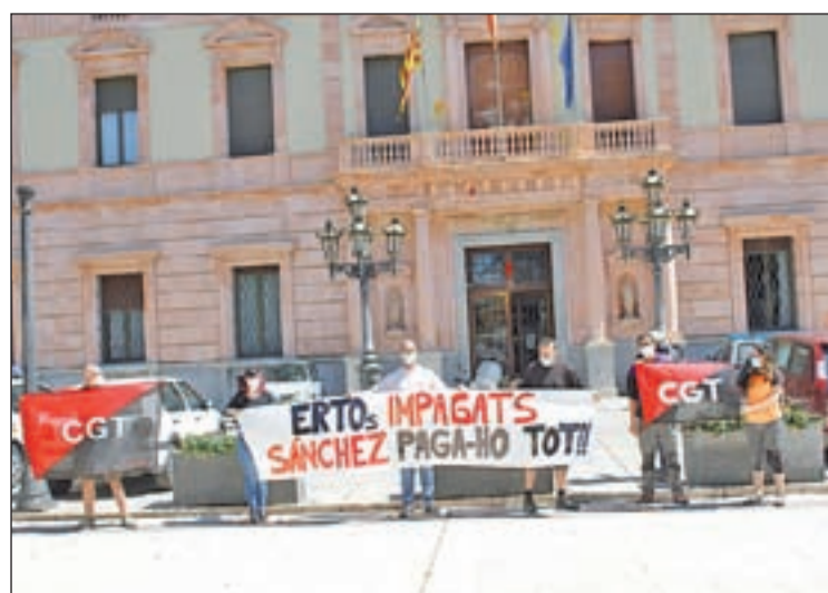
Es van aplegar ahir davant de la Subdelegació

La CGT va denunciar ahir davant de la seu de la Subdelegació del govern espanyol l'impagament dels ERTO. Asseguren que "en molts casos, aquests ERTO són portats a terme per grans empreses els guanys de les quals no s'han rebaixat en gran mesura ja que la producció ha seguit funcionant a molts nivells".