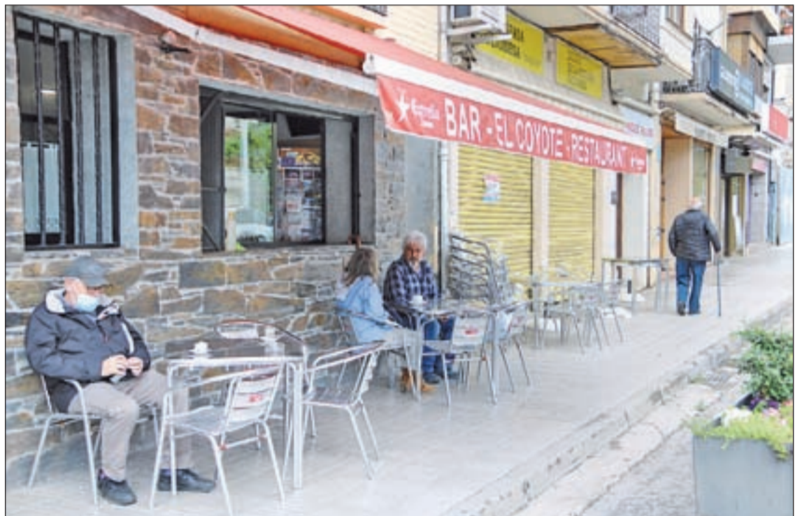
Imatge d'una terrassa d'un bar de Sort on estan en fase 1 des de la setmana passada

Mentre, a l'altre extrem de la regió, l'alcalde de la Vall de Boí