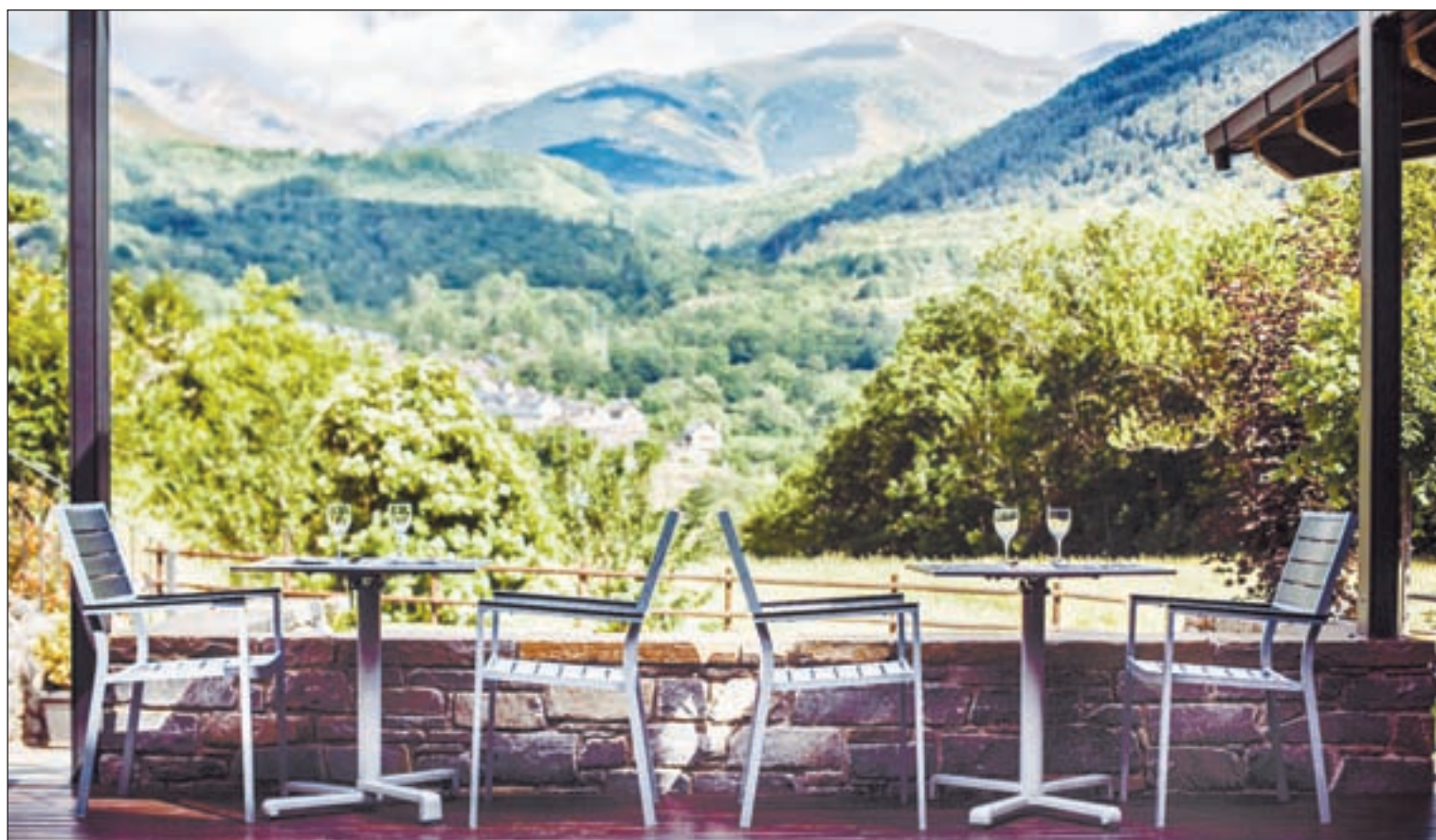
La Vall de Boí és un espai natural que ofereix als turistes l'oportunitat de visitar el Parc Nacional, les esglésies i recórrer els camins

D'aquesta manera, mentre que en els darrers anys ens ha-