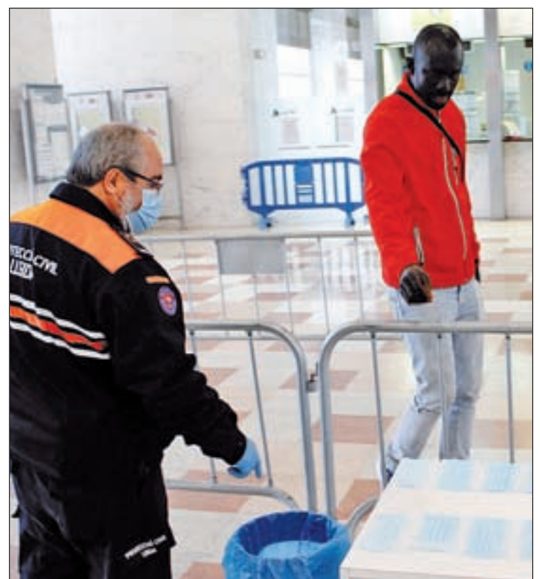
Un del voluntaris que hi ha a la capital del Segrià

nals que hi treballen com dels voluntaris que hi són presents a través d'un pla especial. "Ens estem coordinant constantment, rebent recomanacions i infografies que nosaltres transmetem. I tenim la sort els diferents ens institucionals, com ara els ajuntaments, donen tota mena de suport, encara que sigui amb un telèfon d'ajuda", conclou.