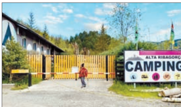
FOTO / El Càmping Alta Ribagorça (esquerra) està situat prop de la població del Pont de Suert, i l'Hotel Terradets (dreta), és a Cellers, al Pallars Jussà