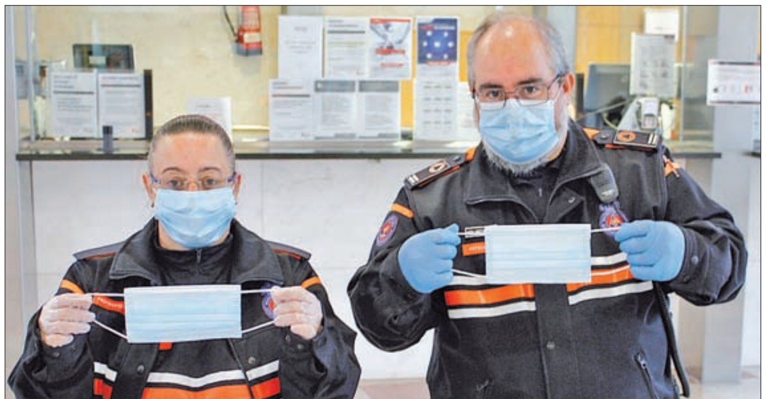
Voluntaris de Protecció Civil, durant el repartiment de mascaretes que es va fer el dimarts 14 a l'estació de Renfe de Lleida

Amb una coordinació mil·lèmtrica amb les diferents ins-