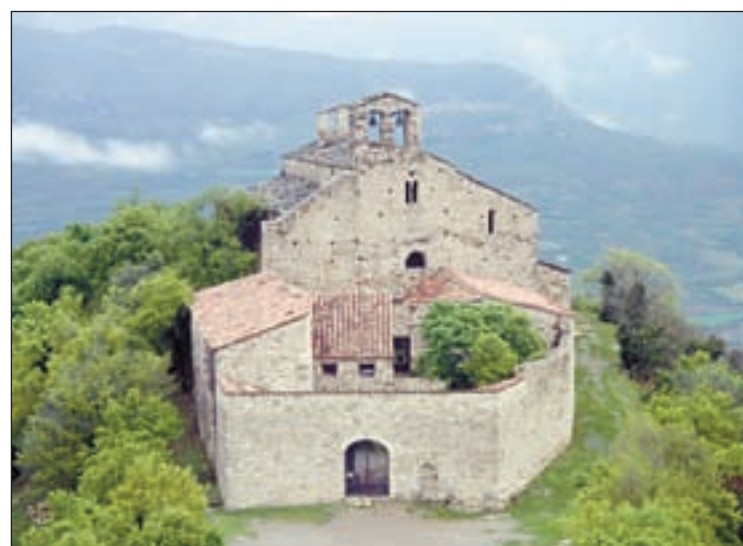
Les pintures de la col·legiata van ser arrencades l'any 1919

Les pintures de Mur són considerades les primeres del romànic català que es van arrencar. Els fets van tenir lloc l'any 1919 i van suposar un punt d'inflexió en la preservació de l'art a Catalunya. Des d'aleshores són al Museum of Fine Arts de Boston.