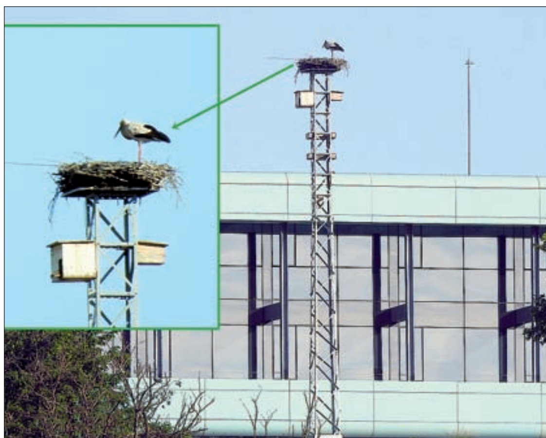
FOTO: Albert Sater (Ipcena) / Fotomuntatge amb un exemplar de cigonya a la torre de biodiversitat

de Lleida va instal·lar al març de l'any passat una torre de biodiversitat al Turó de Gardeny perquè puguin nidificar diferents espècies d'aus. Aquesta estructura,