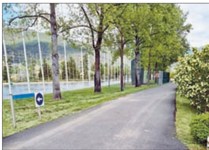
Senyal que indica el sentit del camí

La mesura es va dur a terme després que el passat dilluns es decidís reobrir aquest espai,