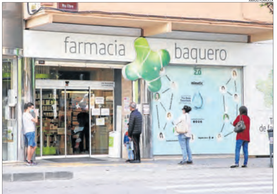
Clients d'una farmàcia a Cappont, fent cua a fora.

Aquest estudi es porta a terme amb la col·laboració de l'Institut de Salut Carlos III i l'Institut Català de la Salut (ICS) és qui el coordina a Catalunya.