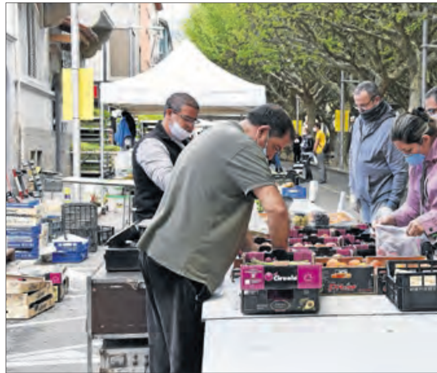
El mercat s'ha traslladat de forma temporal al passeig Joan Brudieu.

166 positius; el Pla d'Urgell, amb 15 morts i 102 casos positius; la Noguera, amb 16 morts i 213 casos positius; el Pallars Jussà, amb 17 morts i 101 casos positius, i, finalment, el Segrià, que té 115 morts i 1.044 casos positius.