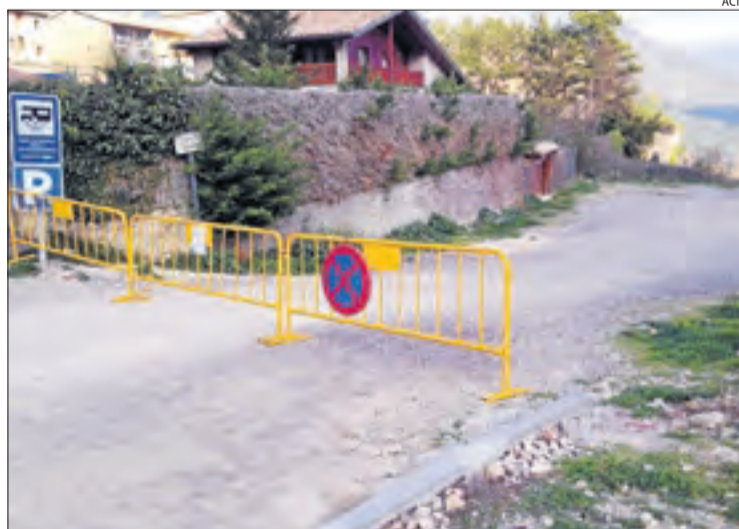
Accessos a Sant Llorenç de Morunys tancats per Setmana Santa.

S'ha de recordar que Sant Llorenç de Morunys va elaborar un cens per saber quines ca-