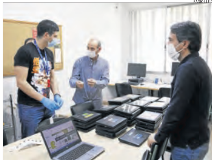
L'institut Josep Lladonosa de Lleida reparteix 53 ordinadors.

El departament reparteix 20.000 equips electrònics perquè alumnes puguin seguir les classes