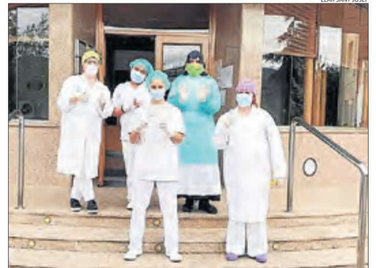
Personal de la Llar de Sant Josep, satisfets amb els resultats.

S'ha de recordar que a la residència Comtes d'Urgell de la capital de la Noguera, que té prop de noranta places, ja s'han registrat vint defuncions per coronavirus i quaranta contagiats. També es van fer tests ràpids a la residència d'Àger i al Centre Geriàtric del Pirineu de la Pobla de Segur, on fonts pròximes van assegurar que s'ha aconseguit contro-