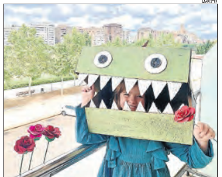
Una alumna del Maristes que ha decorat el balcó aquest Sant Jordi.

La residència del Palau d'Anglesola celebra una diada 'confinada' ■ La residència Ca La Cileta del Palau d'Anglesola va decorar ahir un dels balcons amb una gran rosa per celebrar la diada de Sant Jordi, malgrat les restriccions de mobilitat de l'estat d'alarma. L'ajuntament d'aquesta localitat també va fer una crida perquè els veïns confeccionessin roses i punts de llibre amb material reciclat per als usuaris d'aquest geriàtric.