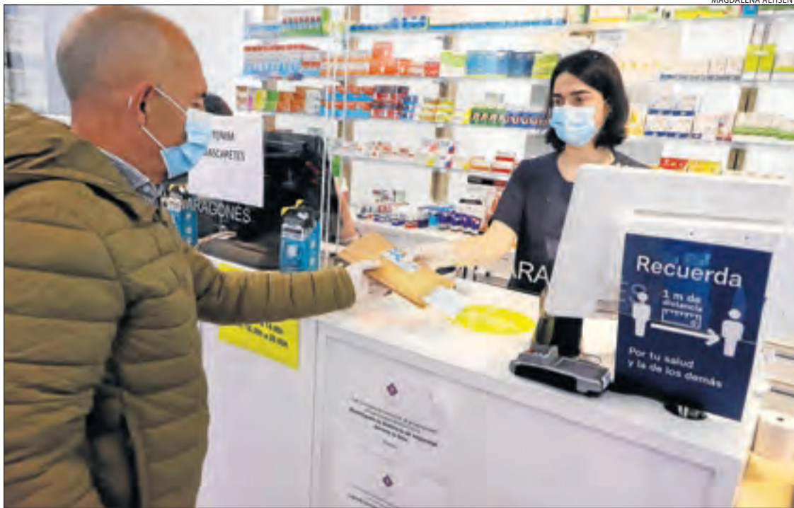
Un client recull una mascareta gratis amb la targeta sanitària a Lleida.