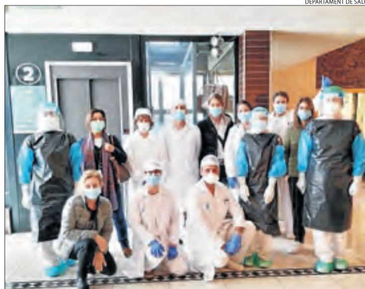
Imatge d'arxiu de professionals sanitaris a l'hotel Nastasi.

Mur destaca que algunes de les necessitats actuals són reforçar la Primària i l'hotel Nastasi