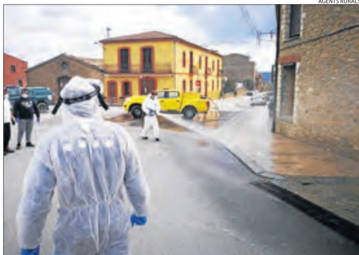
La primera desinfecció la van fer a Àger el 23 de març.

per realitzar cremes controlades, la prevenció d'incendis forestals o la campanya del berriscol dels pollancre. Aquest vehicle ens permet no només desinfectar el terra, sinó també les parets".