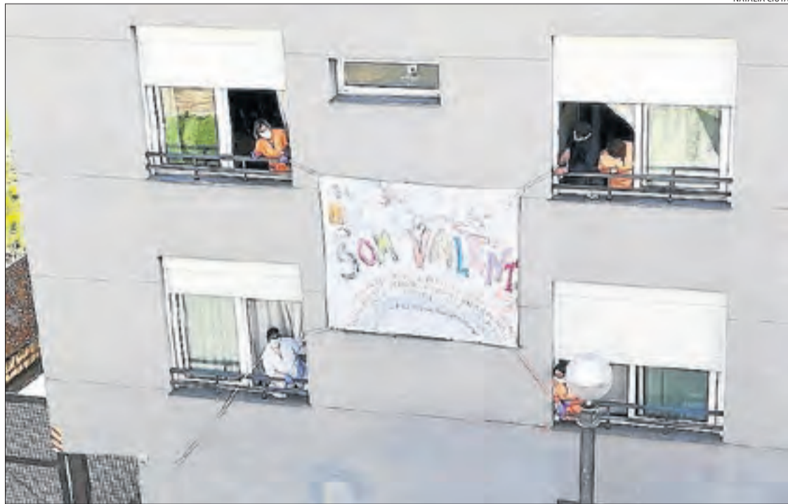
Els treballadors de la residència del Pont de Suert penjant una pancarta a la façana de l'edifici.

Aquesta última setmana s'han repartit més de 500.000 unitats de material sanitari.