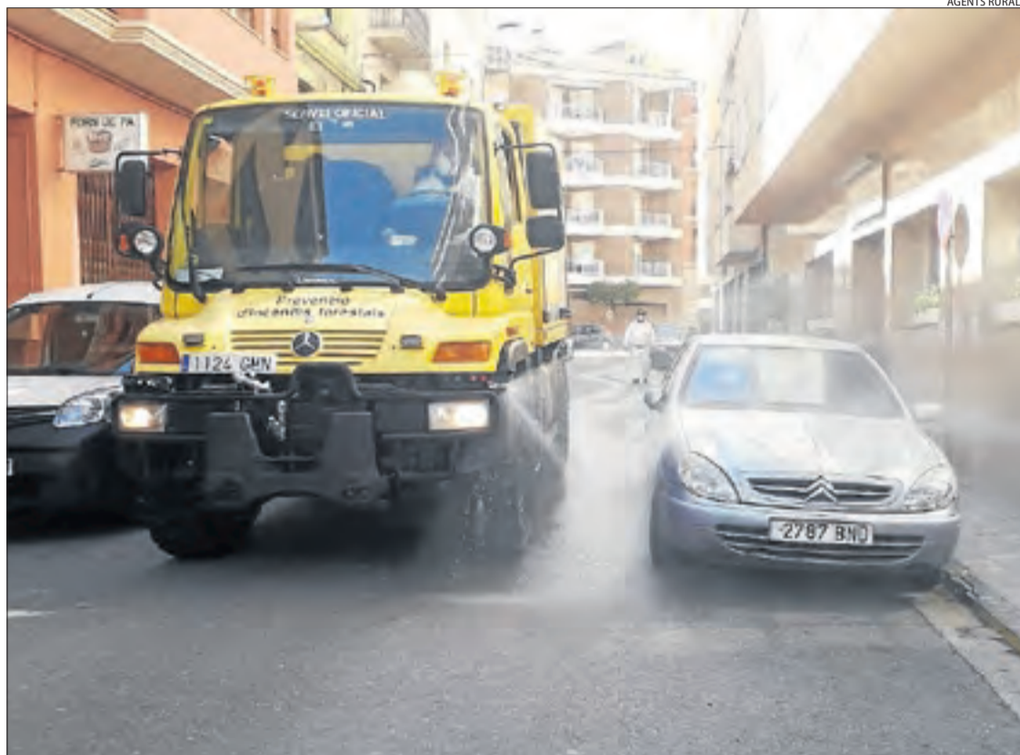
A Sort van desinfectar els dies 3 i 9 d'abril i avui tornaran a desplaçar-se al municipi.