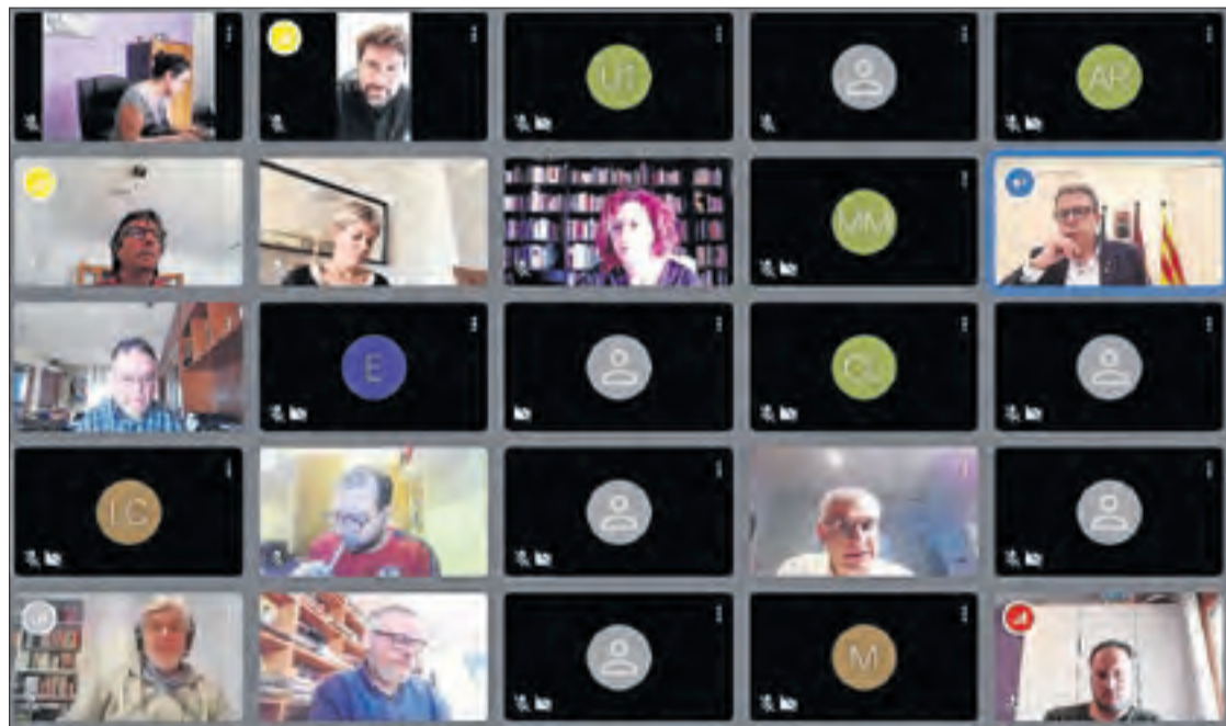
Els nous ajuts a ens locals es van presentar en una roda de premsa telemàtica.

«Si disposen de liquiditat, les administracions locals podran contribuir a la recuperació econòmica un cop conclouï l'alerta sanitària»