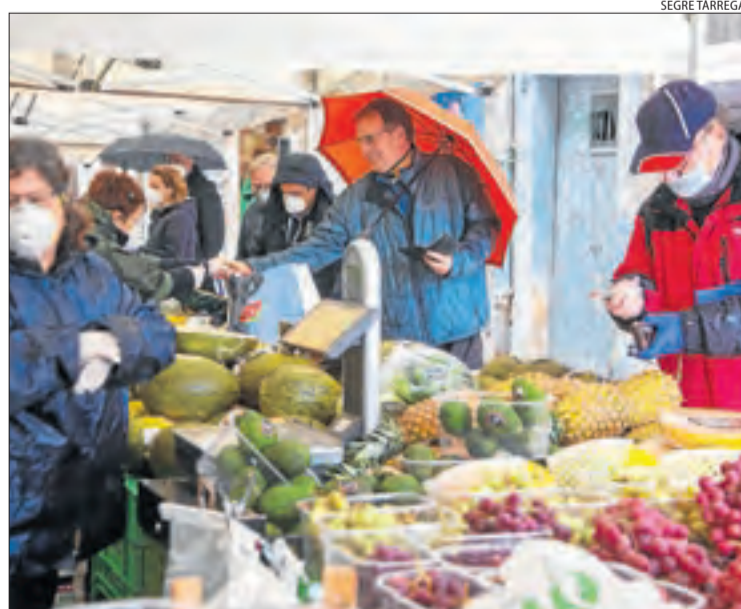
Paradistes i compradors, majoritàriament amb mascaretes.

| TÀRREGA | Tàrraga va celebrar ahir el mercat setmanal, que va estar molt freqüentat malgrat ser Dilluns de Pasqua i tot i la pluja i el confinament. Molts veïns van anar a comprar fruita i verdura fresca i recollir la mona de Pasqua. Tàrraga és, amb Balaguer, una de les poques capitals del pla que encara celebren el mercat, malgrat que només amb parades d'alimentació i seguint mesures de seguretat, informa Segre Tàrraga .