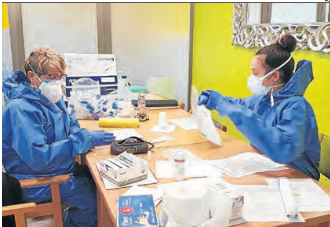
Personal sanitari i material per a tests ràpids a la residència de la Fuliola.

Sota coordinació dels CAP, comptaran amb suport de professionals del Bus de la Salut i de l'ONG Open Arms || Dos defuncions més en centres geriàtrics lleidatans