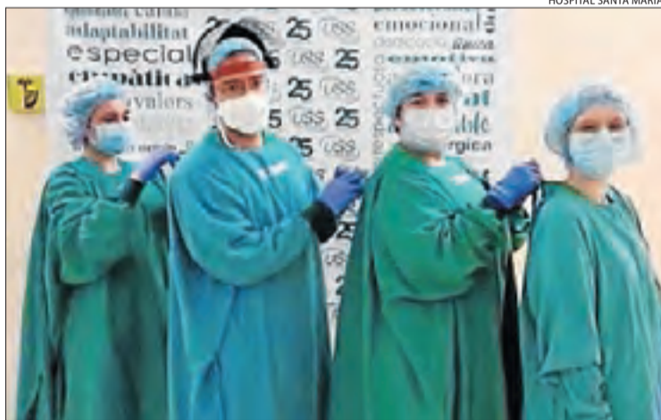
Personal de la Unitat Sociosanitària del Santa Maria.

Ahir hi va haver tres morts més en centres hospitalaris i el total supera els 100