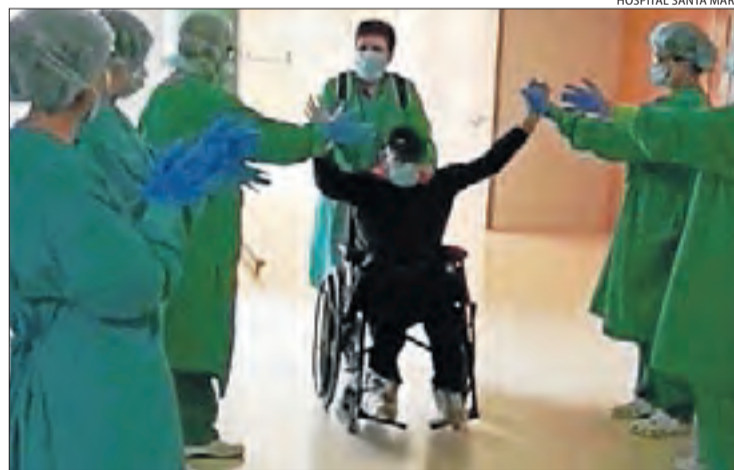
Moment en què un pacient del Santa Maria rep l'alta.