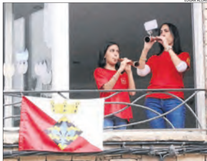
A Vilanova de Bellpuig, recitals des dels balcons.

suspensió de les festes del Roser, que se celebra a principis de maig. L'ajuntament tenia previst destinar una part del pressupost de la festa a activitats infantils, que ara s'han destinat per comprar més de 70 d'aquests ous.