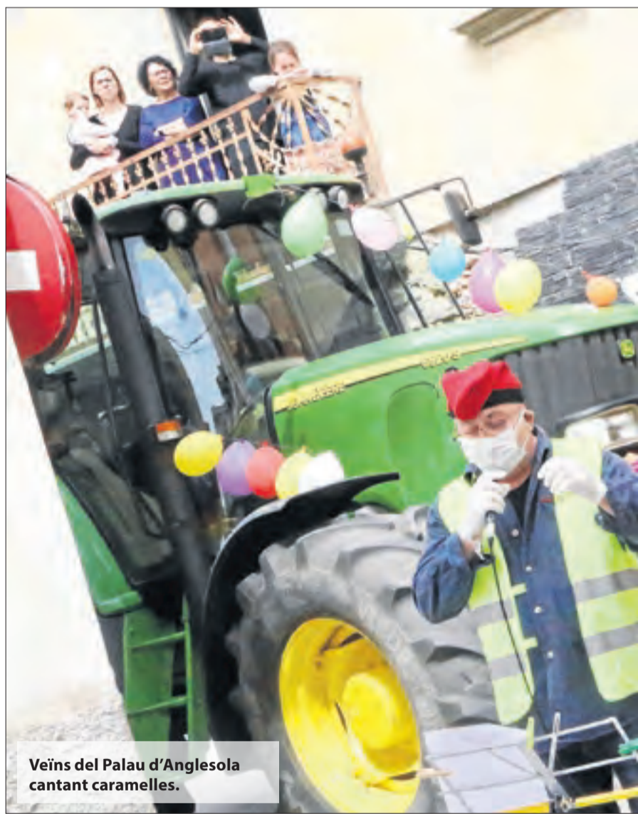
Veïns del Palau d'Anglesola cantant caramelles.