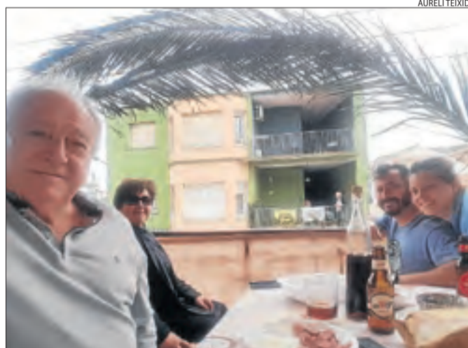
Una família de la Granja d'Escarp, amb la mona al balcó.