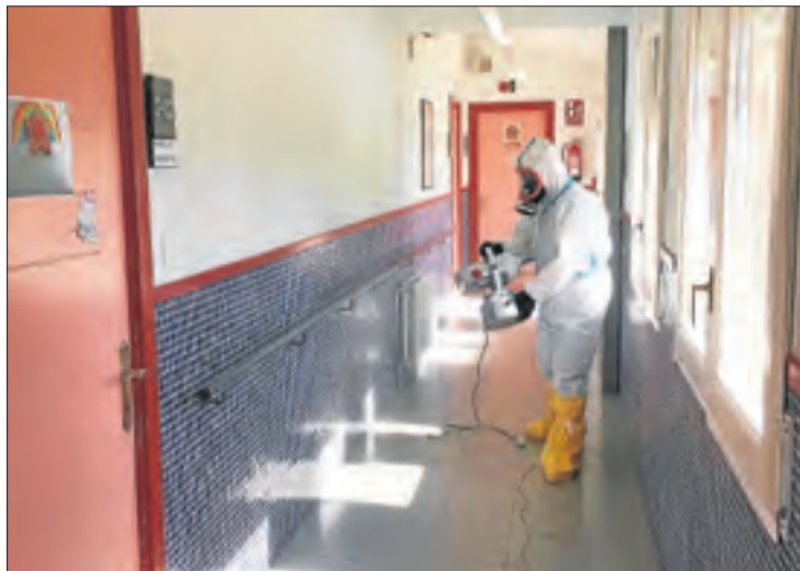
L'Exèrcit va desinfectar ahir la residència Comtes d'Urgell de Balaguer.