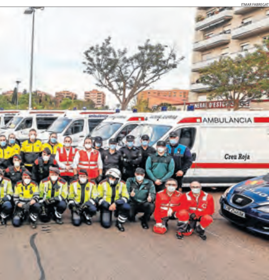
es a la població amb una rua pels carrers de Lleida.

Informació sobre el coronavirus al web http://canalsalut.gencat.cat/coronavirus-test/