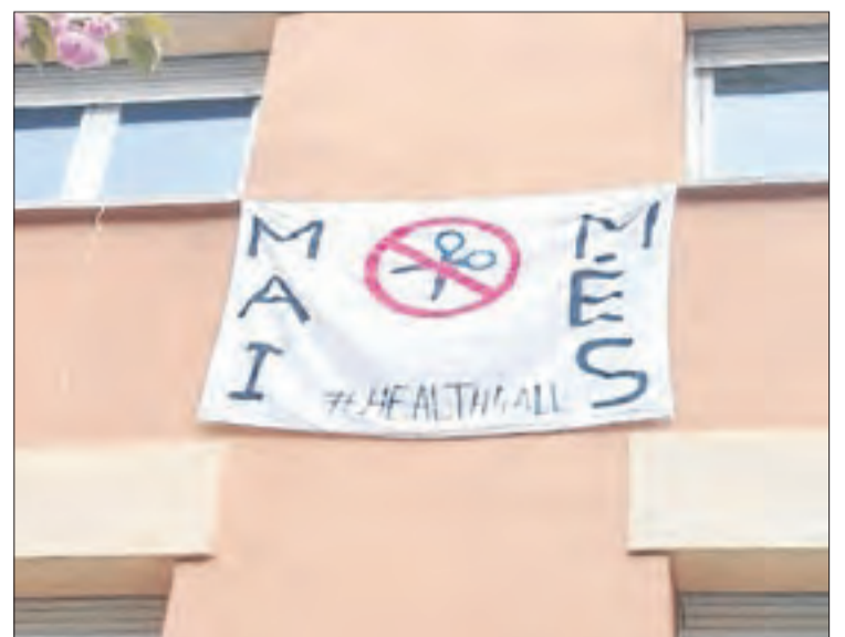
Un altre missatge denunciant les retallades al mateix barri.