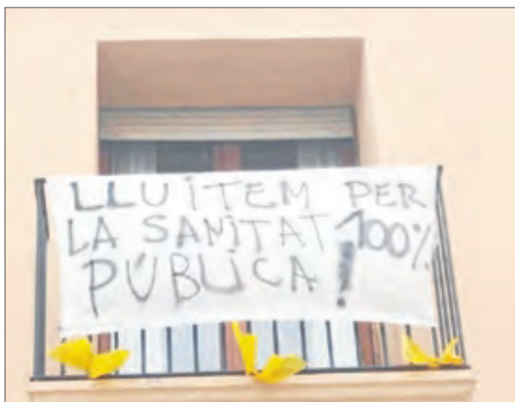
Una pancarta defensant la sanitat pública a Capponet.

LLEIDA | Diversos balcons i finestres de la ciutat de Lleida van lluir ahir pancartes en defensa de la sanitat pública, amb motiu del Dia Mundial de la Salut, que se celebra el 7 d'abril. Amb el hashtag #Health4All (Salut per a tothom) les xarxes es van omplir de missatges en què denunciaven les retallades al sector per la crisi i van exigir una sanitat pública i de qualitat. A més, van agrair el treball intens que fa aquests dies tot el personal sanitari.