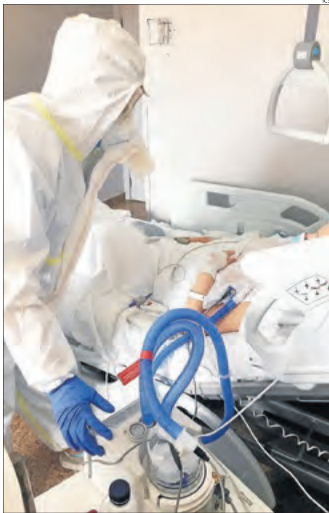
Un sanitari amb un sistema de ventilació mecànica.