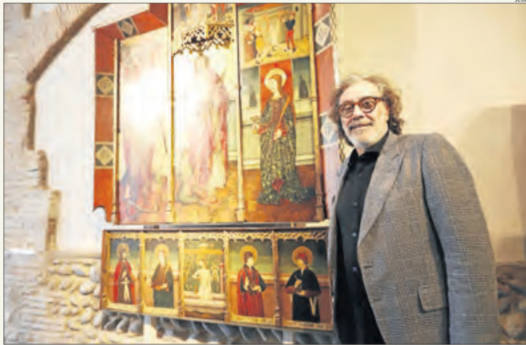
Imatge del periodista i empresari Tatxo Benet fa uns mesos al Museu de Lleida.