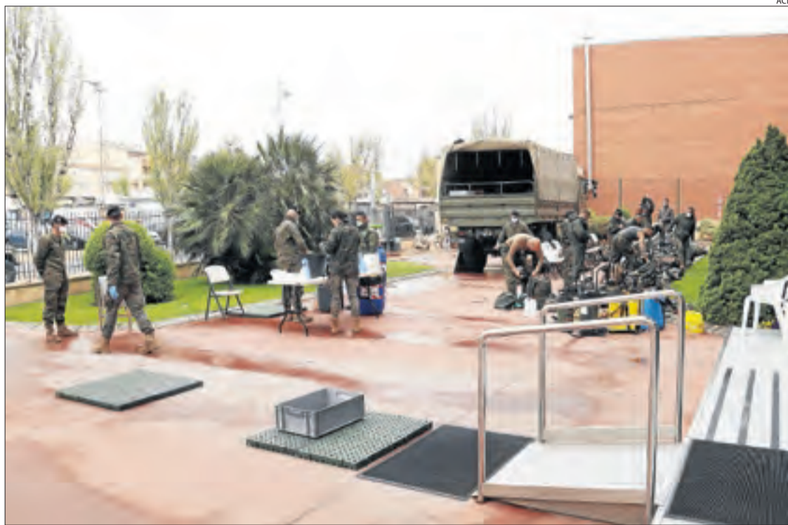
La brigada de l'Exèrcit de Terra es preparava ahir per desinfectar la residència d'Alcarràs.

És la xifra de defuncions en residències de Lleida fins ahir, la mateixa que dilluns.