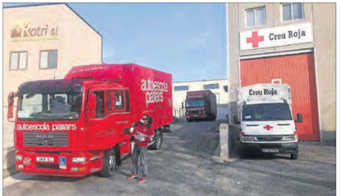
Vehicles de l'Autoescola Pallars reparteixen aliments a seus de Creu Roja, que els distribuirà.

Per a afectats de Covid-19 en quarantena i persones amb patologies cròniques o problemes de mobilitat