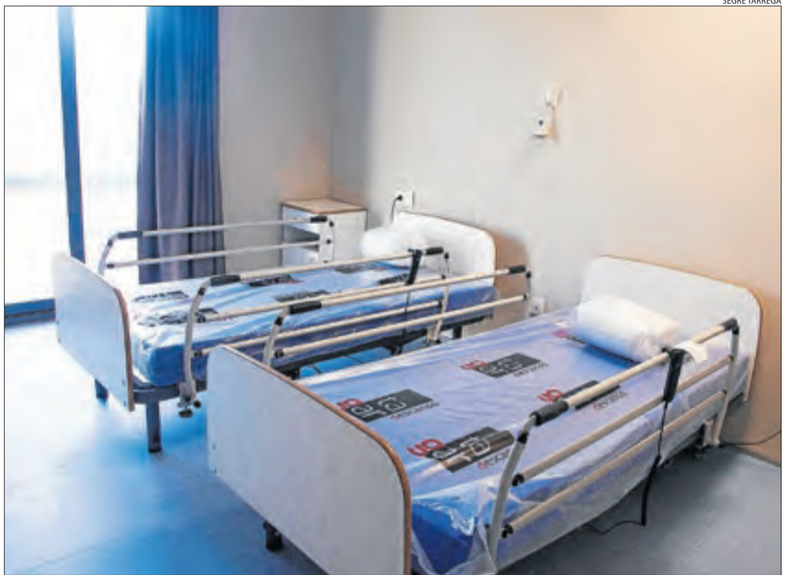
Imatge de l'interior de la residència d'Anglesola, que acollirà ancians de Lleida.

L'alcaldeessa d'Anglesola assegura que els ancians que es traslladaran no tenen el Covid-19