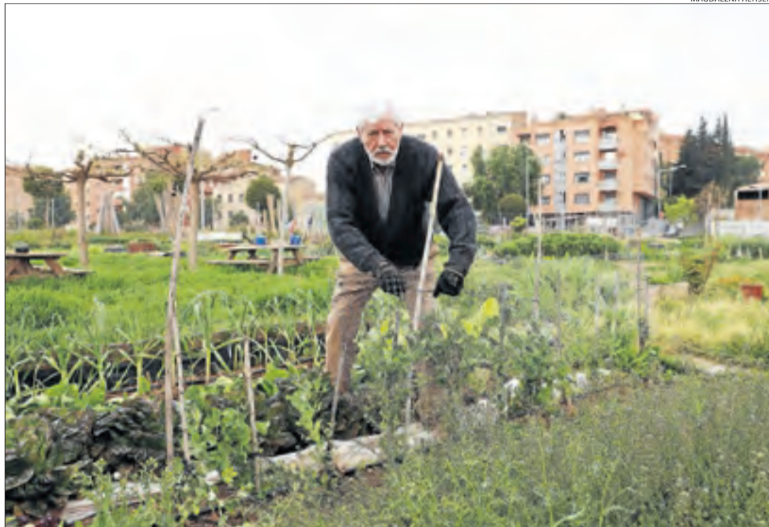
Un veí treballant ahir al seu hort urbà de Pardiniyes.

| TREMP | La majoria de comerços de proximitat de Tremp s'han afegit a la iniciativa SlowShooping.cat per oferir a través d'un portal web un servei a domicili dels seus productes i els clients poden continuar comprant sense sortir de casa. S'hi poden afegir a la iniciativa els comerços del Pallars que vulguin.