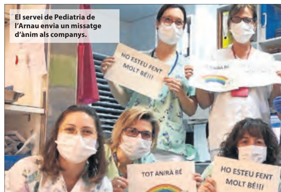
El servei de Pediatria de l'Arnau envia un missatge d'ànim als companys.

Tanmateix, responsables de les regions sanitàries de Lleida i Alt Pirineu i Aran van assegurar ahir que "no està previst aplicar aquest protocol" i que "continuarem amb la línia