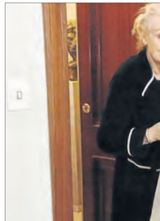
Abella entrega un menú diari a una veïna de l'edifici El Balcó de Lleida.

El Govern recorda que la llei reconeix les comunitats islàmiques el dret a la concessió de parcel·les reservades per als enterraments als cementiris, així com el dret a tenir equipaments funeraris propis. La Generalitat