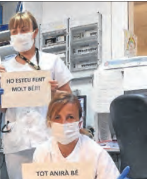
HOSPITAL ARNAU DE VILANOVA

que els sanitaris tornin a treballar quan el test de PCR doni negatiu".