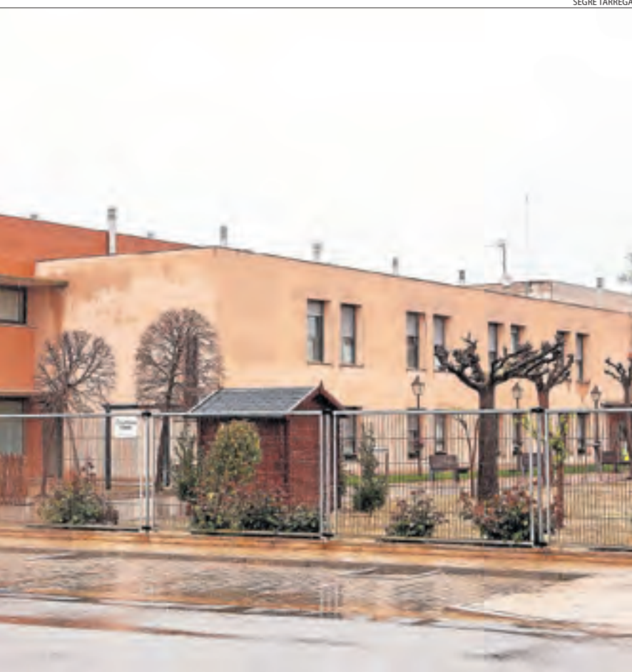
Usuaris en els últims dies.

■ L'Hotel Tryp de Vielha, que es va habilitar per acollir pacients lleus de coronavirus per alleujar la càrrega assistencial de l'hospital aranes, encara espera rebre els primers contagiats. La Generalitat també preveu hotels hospital a la Seu d'Urgell i un altre a Tremp.