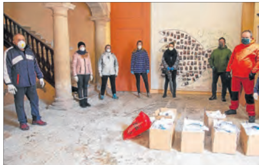
Voluntaris de Tornabous amb les mascaretes.

el Tarròs i la Guàrdia d'Urgell) mascaretes que durant el cap de setmana va cosir un altre de grup de voluntaris a partir d'uns equips que va adquirir el consistori. L'objectiu és que si els veïns han de sortir al carrer, puguin protegir-se alhora que contribueixen a frenar la propagació del coronavirus. Els voluntaris també van deixar instruccions als habitatges perquè coneguin com rentar les màscares després d'usar-les i van demanar als veïns si