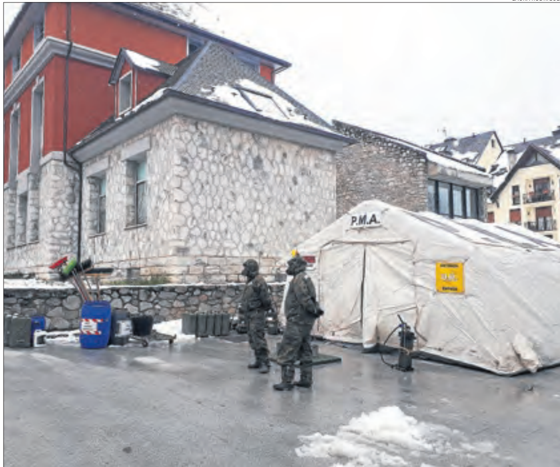
L'Exèrcit va desinfectar dilluns l'hospital i la residència de la tercera edat de Vielha.

| ALMENAR | Entitats d'Almenar han aconseguit en un període de menys de dotze hores recaptar a través d'una campanya de micromecenatge fins a 6.000 euros per a una impressora 3D que permeti l'elaboració de màscares de protecció.