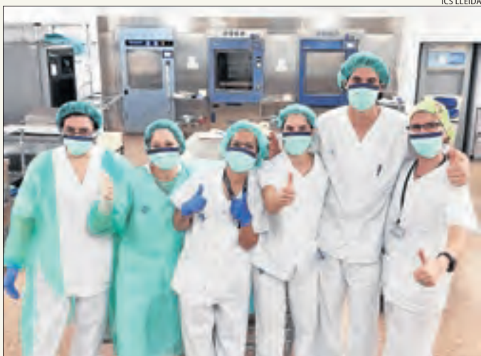
Equip d'esterilització ■ Foto de família de l'equip d'esterilització de l'hospital Arnau de Vilanova, al qual el centre va agrair ahir a través de les xarxes socials “la feina tan important que fa”.