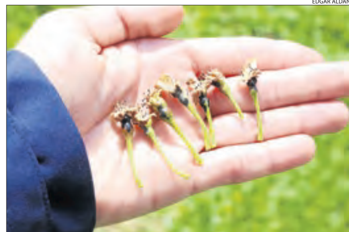
Peres afectades per la gelada al pla, la setmana passada.