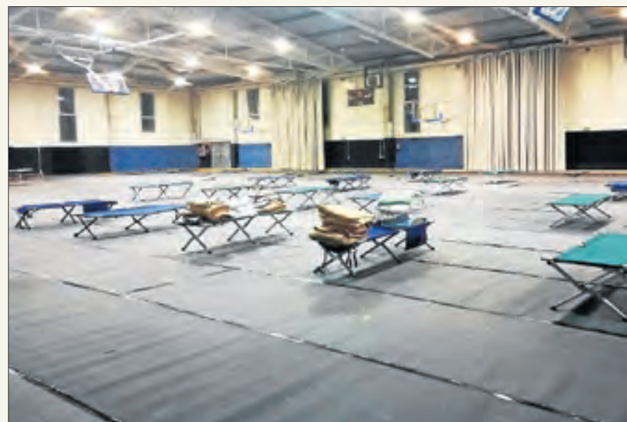
L'interior del pavelló on dormen les persones sense sostre.

El pavelló Agnès Gregori de Balàfia acull actualment 42 persones sense sostre que no tenien on passar el confinament. Els quatre usuaris que van mostrar símptomes i van ser traslladats a l'hotel Rambla ja es troben asimptomàtics, va afirmar la Paeria. El tinent d'alcalde Sergi Talamonte va agrair ahir a Twitter la tasca realitzada pels treballadors dels serveis socials i va destacar que el refugi té “les màximes comoditats possibles”.