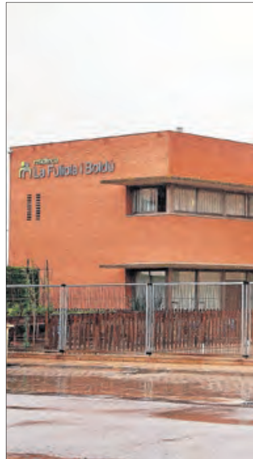
La residència de la Fuliola, que ha perdut 14 de