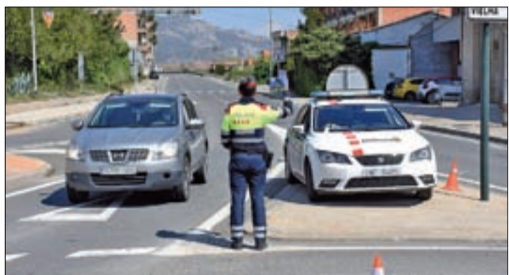
Control realitzat ahir pels Mossos a l’N-230, a Alfarràs

La Urbana de Lleida sanciona 63 persones