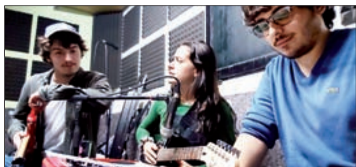
Els tres finalistes del concurs de música

A la residència d'avis del Pont de Suert tots els residents estan bé de salut, gràcies, en bona part, a la gran feina que desenvolupen les seves treballadores i les cuidadores.