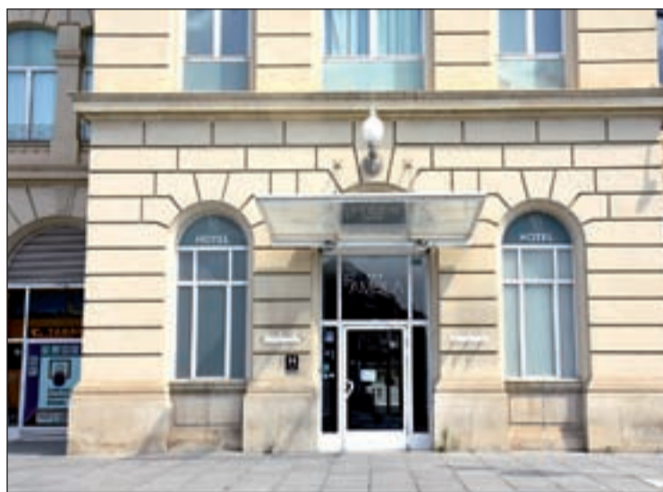
L'hotel Rambla, que s'habilita per atendre pacients

Segons explica la Paeria, l'Hotel Rambla s'ha habilitat per atendre les necessitats assistencials, sanitàries o de suport als pro-