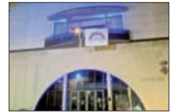
La façana del consistori il·luminada de blau

L'Ajuntament de Rosselló vesteix les façanes de la Casa de la Vila amb llargs blaus, com a mostra de suport, reconeixement i agraïment a tots els professionals del sector sanitari. D'aquesta manera, el consistori del municipi també fa extensible aquest gest commemoratiu a tots els veïns i veïnes de Rosselló, grans i petits, tant si treballen o es queden a casa, que s'adapten i s'esforcen per millorar la situació d'emergència sanitària actual.