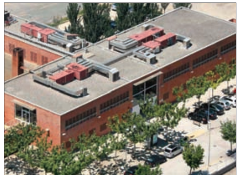
FOTO:/ Imatge aèria del Centre d'Atenció Primària de Tàrrrega