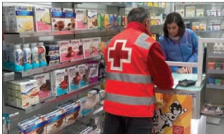
FOTO:/ Els voluntaris de Creu Roja faran entrega dels medicaments

A més, la campanya promou la compra directa o a través de les carnisseries locals de carn, moltes de les quals procedents de races de bestiar protegides de la ramaderia local que ajuda a conservar el paisatge agroromà del parc i la biodiversitat dels prats de dall i pastures.