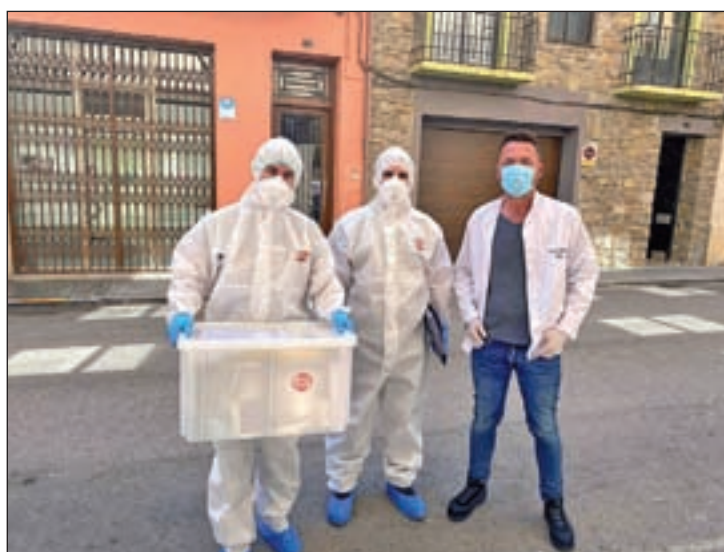
FOTO / L'estudi va començar ahir a la tarda i se'n desconeix la durada

va arribar als 39 casos positius en covid-19 i es van registrar 8 defuncions. Es tracta, doncs, del brot de coronavirus més important que hi ha actualment a la demarcació de Lleida en una residència de gent gran. De fet, aquest va ser el primer geriàtric on una unitat de l'Exèrcit provi-