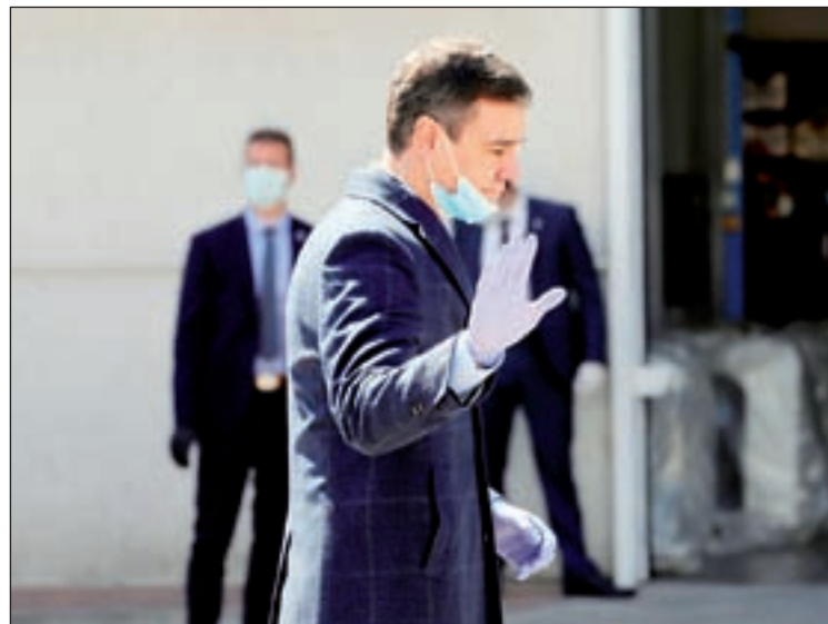
Pedro Sánchez visitó una fábrica de respiradores