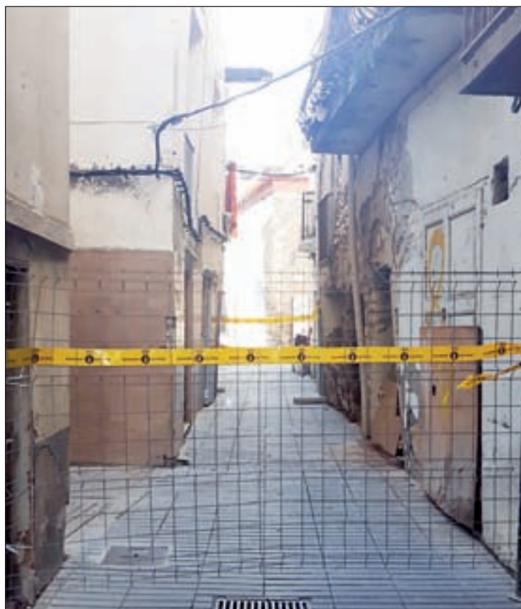
El carrer, acordonat a l'alçada de les cases