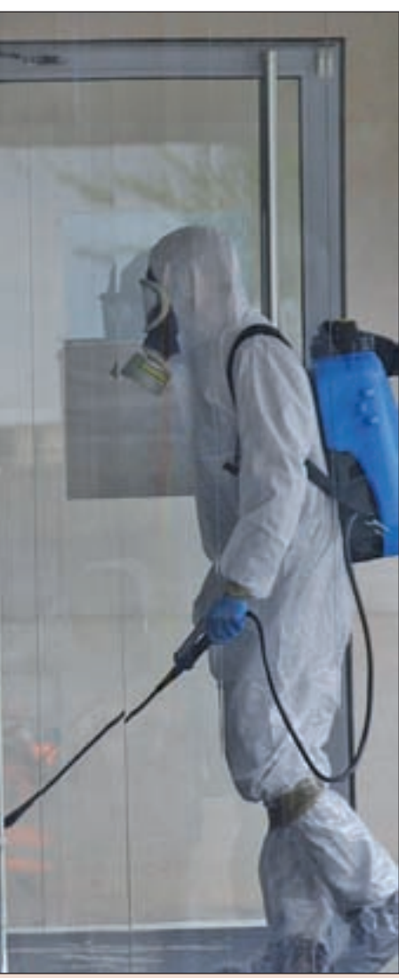
FOTO: Tony Alcántara / Moment de la desinfecció de la Residència de Sant Josep de Lleida