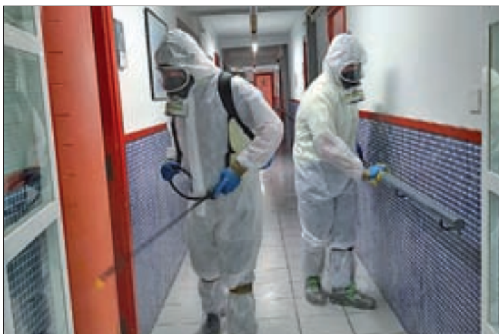
Les tasques de desinfecció d'ahir a Balaguer