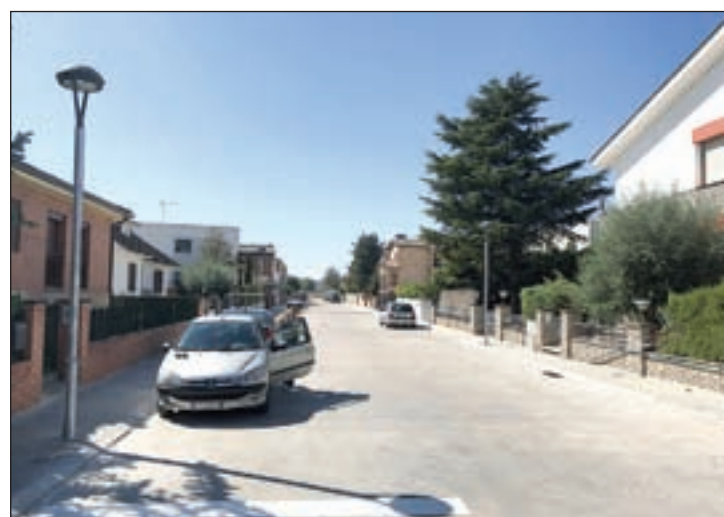
Els treballs han permès ampliar les voreres