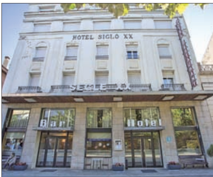
Imatge del segon hotel que atèn pacients estables

una ala de l'hospital i disposar de més llits. Per la seva part, la tercera planta de l'Hospital Arnau de Vilanova de Lleida s'ha tancat per poder acollir futurs pacients que hagin donat positiu en coronavirus. En aquest sentit, fonts hospitalàries van manifestar ahir en declaracions a LA MAÑANA que "el funcionament de l'hospital s'adapta cada dia a les necessitats assistencials amb la màxima flexibilitat que la situació actual requereix".