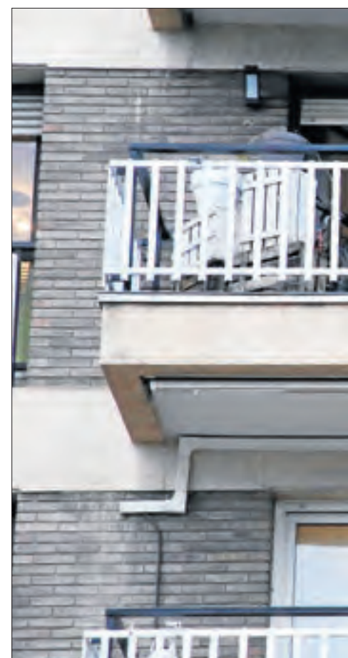
Aplaudiments en suport als sanitaris a plena llum del dia

Va remarcar que actualment no poden obrir els concessionaris i que els tallers tan sols funcionen en cas de reparacions d'emergència, de manera que té