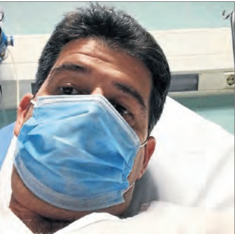
l'hospital Arnau de Vilanova.