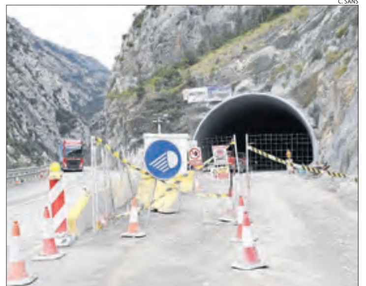
Les obres del túnel de Trespunts, que ahir ja estaven paralitzades.