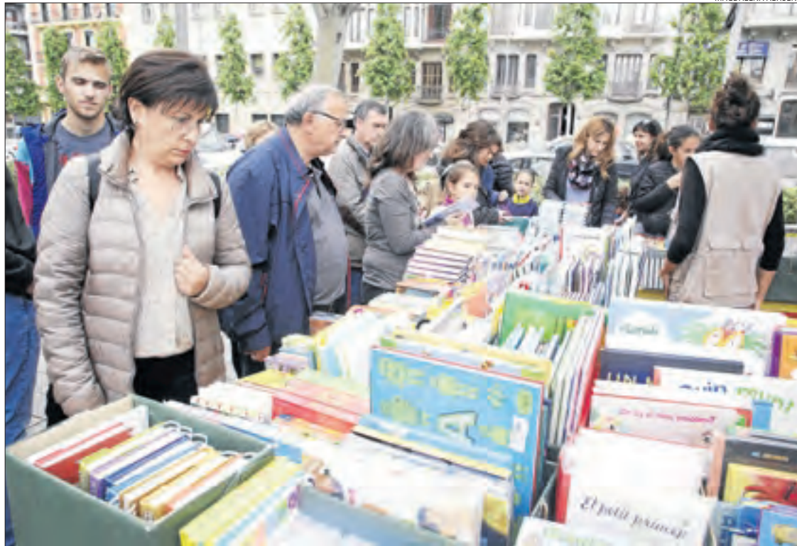
Parades de llibres la passada diada de Sant Jordi a Lleida, una imatge que enguany no es repetirà.

Les llibreries van vendre 30.785 llibres al dia el març del 2019, xifra total a què s'aspira aquesta campanya