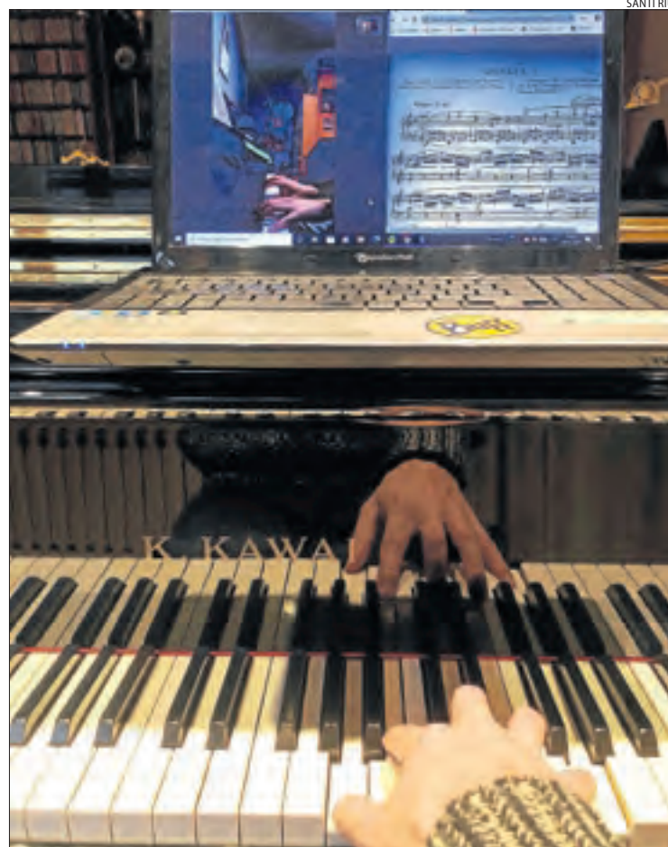
Enregistraments de classes a través de la xarxa i videotrucades.