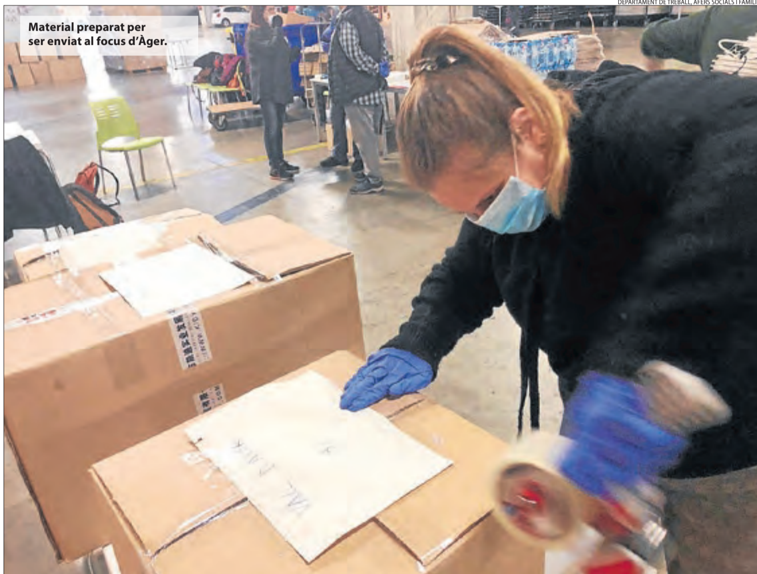
Material preparat per ser enviat al focus d'Àger.

DEPARTAMENT DE TREBALL, AFERS SOCIALS I FAMÍLIES