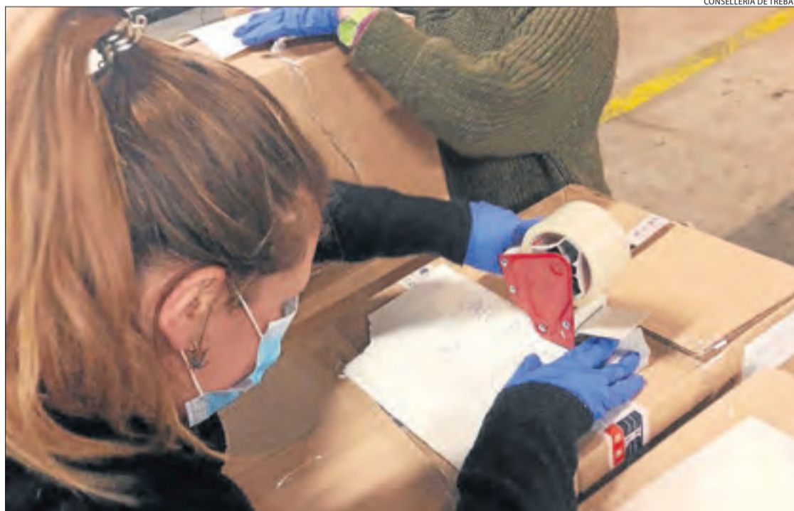
Una operària preparant productes sanitaris destinats a Àger, ahir, a l'aeroport del Prat.

A més, des de l'inici de la pandèmia, 76 persones s'han curat a Lleida després de sumar ahir onze noves altes. D'entre els casos per coronavirus que segueixen en actiu, 47 pacients es troben ingressats a l'UCI, dels quals 36 a l'Hospital Universitari Arnau de Vilanova, que ahir va fer una crida davant de la "necessitat" de personal, i onze al Santa Maria. Segons