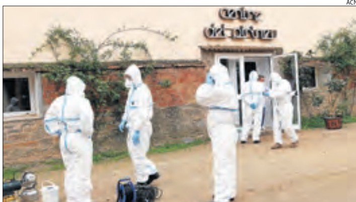
L'UME, desinfectant la residència de la Pobla de Segur.

■ Amb 34 casos confirmats i dos morts, el principal focus és a la residència de la Pobla, on ahir hi havia 9 encomanats.