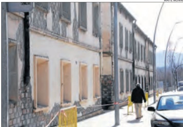
Un home al costat dels antics habitatges dels ferroviaris.

D'altra banda, Baró va explicar que la Sareb o banc do-