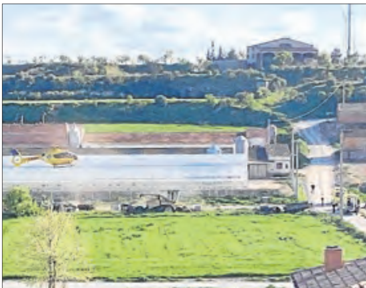
El ferit va ser evacuat en helicòpter.

El vehicle va passar, pel que sembla, per sobre de l'home, en un accident que es va produir a les 16.30 hores