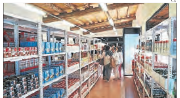
El centre de distribució del Banc dels Aliments de la Seu.

■ Hi ha 23 positius a la comarca. Tres continuen ingressats al Sant Hospital, on divendres va morir una persona gran.