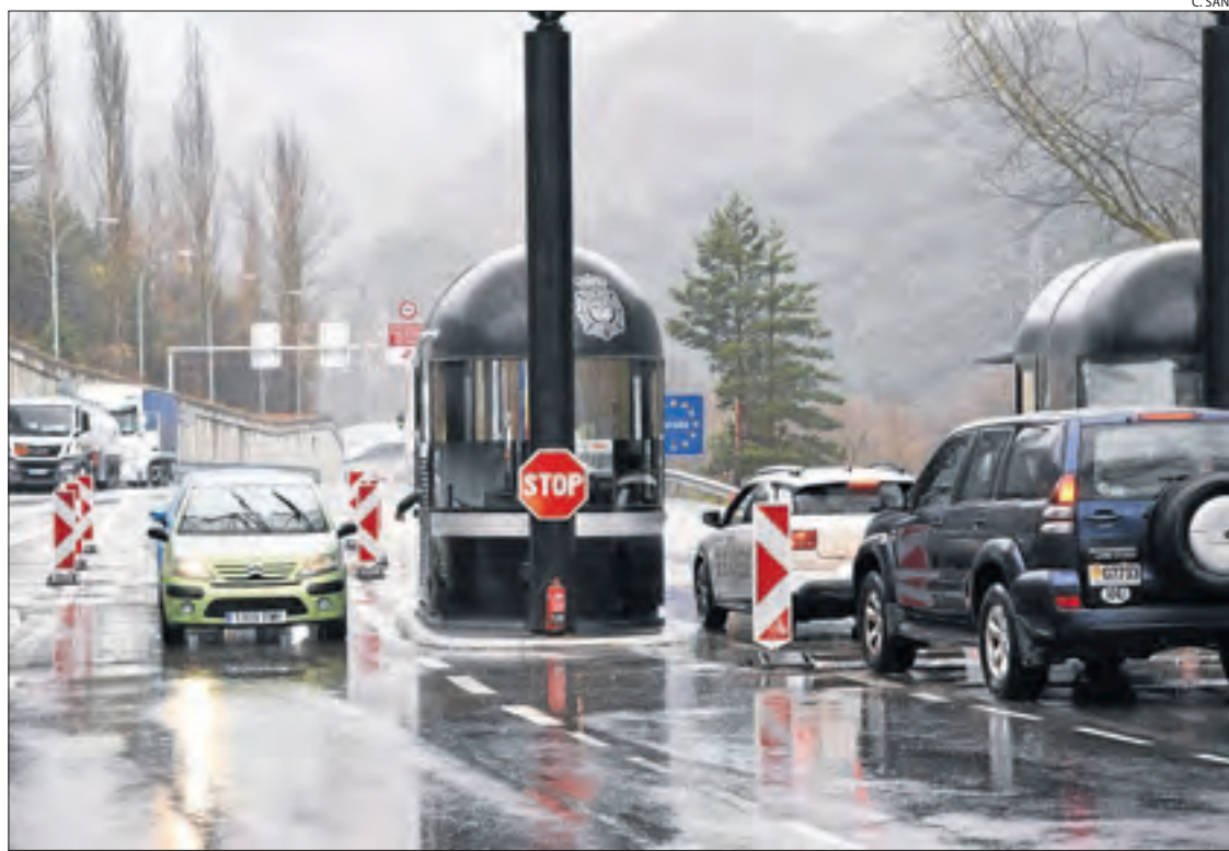
Vehicles aturant-se aquesta setmana al punt fronterer de la Farga de Moles.

A banda del transport de mercaderies, també poden circular,