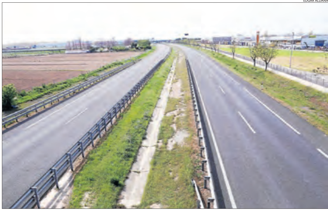
L'autovia A-2, ahir presentava aquest aspecte, completament deserta.

Informació sobre el coronavirus al web http://canalsalut.gencat.cat/coronavirus-test/