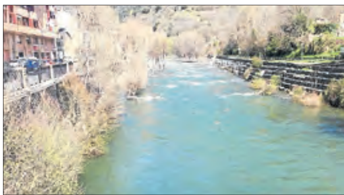
El camp de regates de Sort, completament buit.

■ Hi ha 8 casos de coronavirus confirmats al Sobirà segons Salut, 6 dels quals estan ingressats a l'Hospital del Pallars.