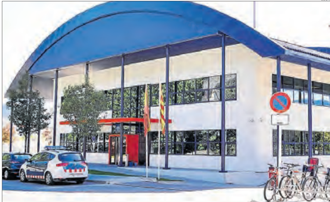
Imatge de la comissaria de la Seu d'Urgell.