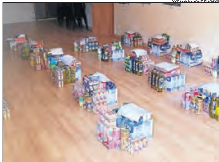
Lots del banc d'aliments de l'Alta Ribagorça.

EL PONT | Un total de 42 famílies amb 139 persones en situació de vulnerabilitat es beneficien del banc d'aliments que gestiona el consell de la Ribagorça. La recollida de productes s'ha de fer en intervals de deu minuts i només pot anar-hi un membre de cada família per evitar contagis de coronavirus.