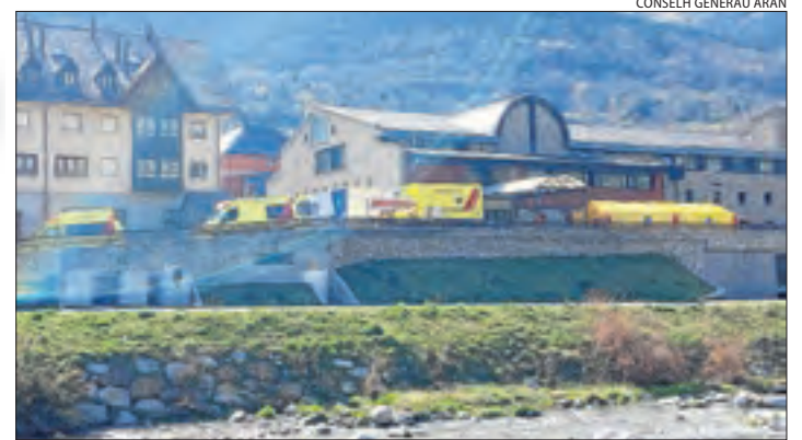
L'hospital de campanya instal·lat al costat de l'Espitau de Vielha.

■ Els casos confirmats ascendeixen a 26, segons Salut, una xifra que el Consell eleva a 35, i ja han mort dos persones.