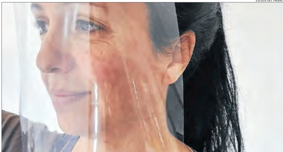
Imatge de la pantalla de protecció que fabrica l'Escola del Treball.

■ El CEO de l'empresa Electrònica Màxim Miranda va afirmar que també han dissenyat "una solució de càmeres tèrmiques, com les que s'han instal·lat a la Xina, que dos institucions de control de fronteres estan implementant a l'Estat espanyol". "Té una precisió molt alta de detecció precoç de febre", va assenyalar, encara que va puntualitzar que es pot tenir la temperatura alta per qüestions mèdiques no relacionades amb el coronavirus.