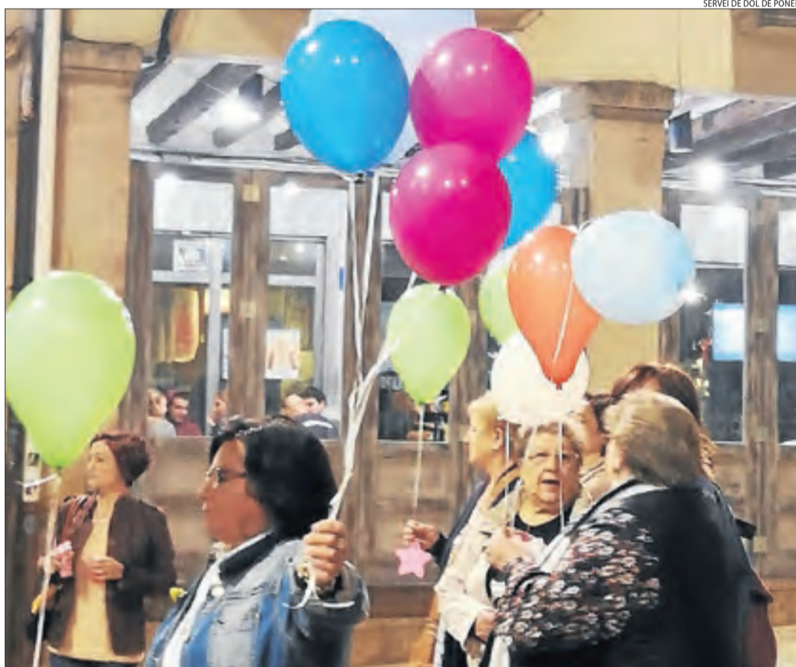
Llançar globus, una alternativa de comiat. A la imatge, un acte de l'octubre a Tàrraga.