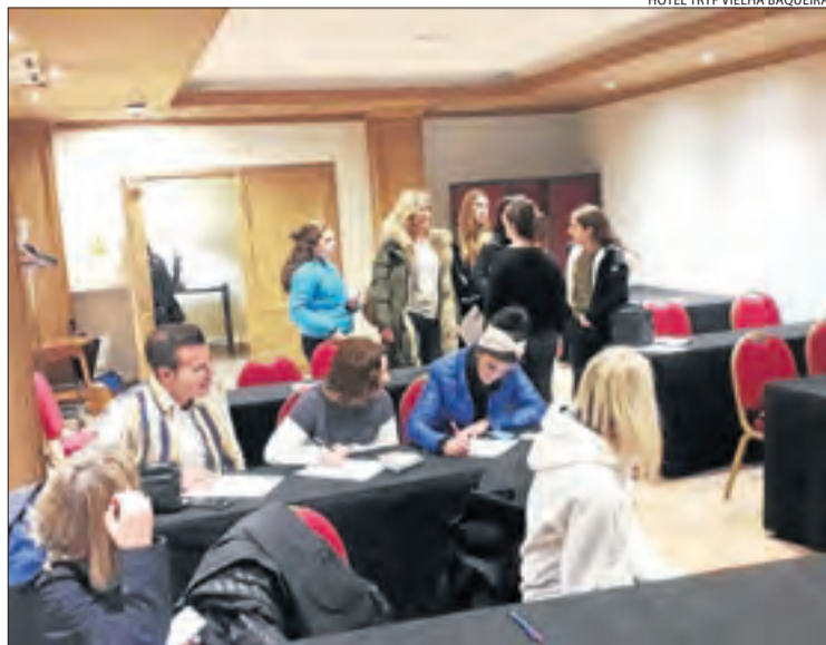
HOTEL TRYP VIELHA BAQUEIRA