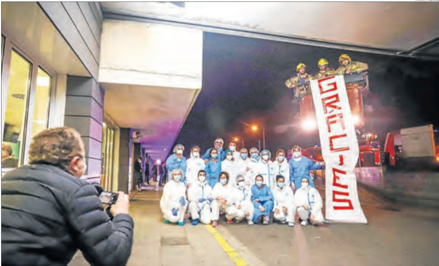
Mossos, bombers i urbans van homenatjar ahir a la nit els professionals de l'Arnau. A la imatge, un grup de sanitaris i bombers.