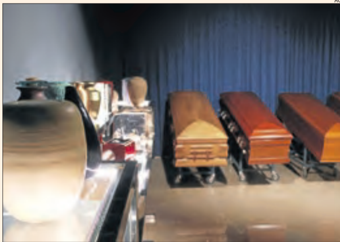
Imatge d'arxiu d'una funerària a Mataró.

■ El Consell Executiu va acordar ahir poder intervenir els serveis funeraris durant la crisi sanitària i limitar així el preu dels enterraments. Segons va explicar la portaveu del Govern, Meritxell Budó, aquests serveis són declarats de prestació "forçosa" mentre es mantingui la urgència sanitària, amb un preu màxim determinat, en funció del servei, i que abasti una prestació bàsica imposada legalment. Per a Budó, s'ha d'assegurar que la prestació dels serveis funeraris en la pandèmia actual es fa "de forma contínua i universal", garantint el dret dels usuaris i "reduint tots els riscos possibles", i evitar possibles abusos per part de les funeràries. El Govern justifica aquestes mesures perquè "es considera adequat establir mesures que permetin agilitzar el temps a donar el corresponent destí final". La