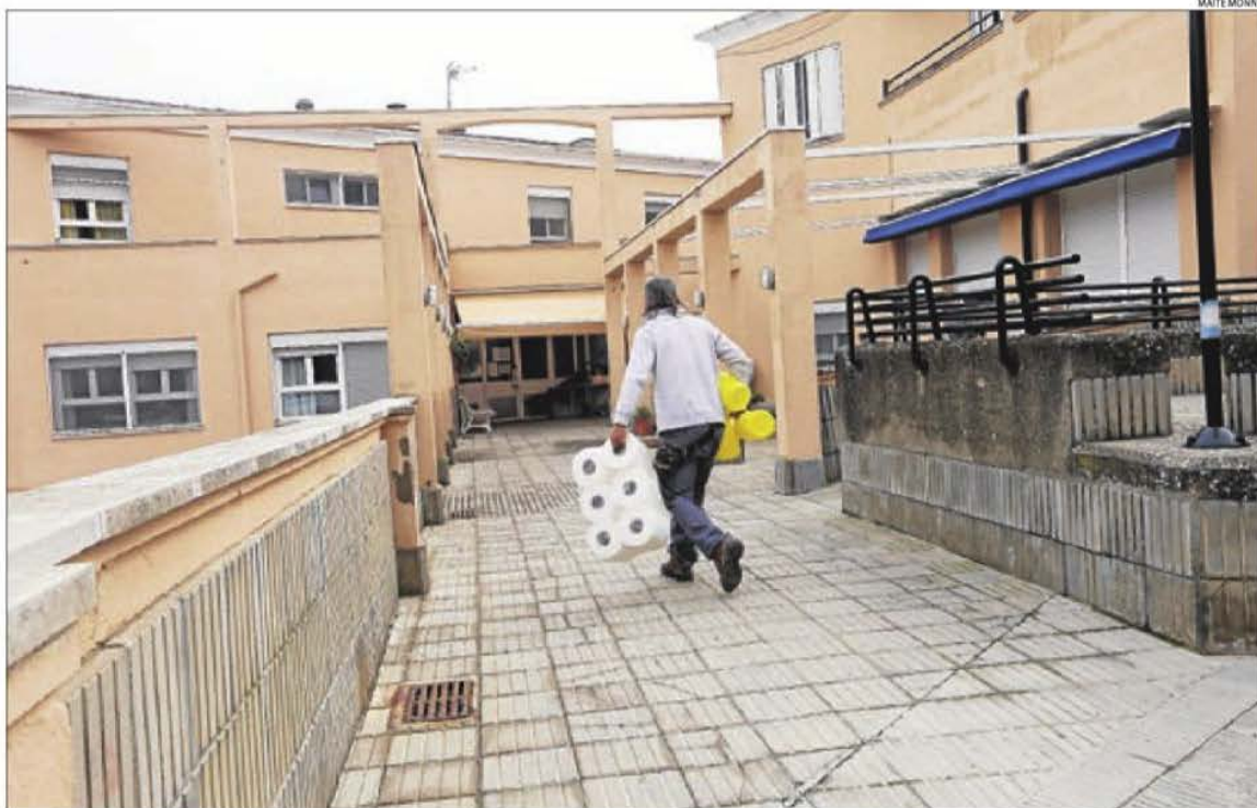
Una persona entrant ahir a la residència geriàtrica d'Àger, un dels principals focus de coronavirus a Lleida.

A més, vuit empleats de la residència estan de baixa al presentar símptomes de coronavirus. Per aquesta raó, l'ajuntament va fer ahir una crida per trobar treballadors i voluntaris per pal·liar la falta de personal. En aquest sentit, al matí la residència d'Àger comptava amb sis treballadors i durant la jor-