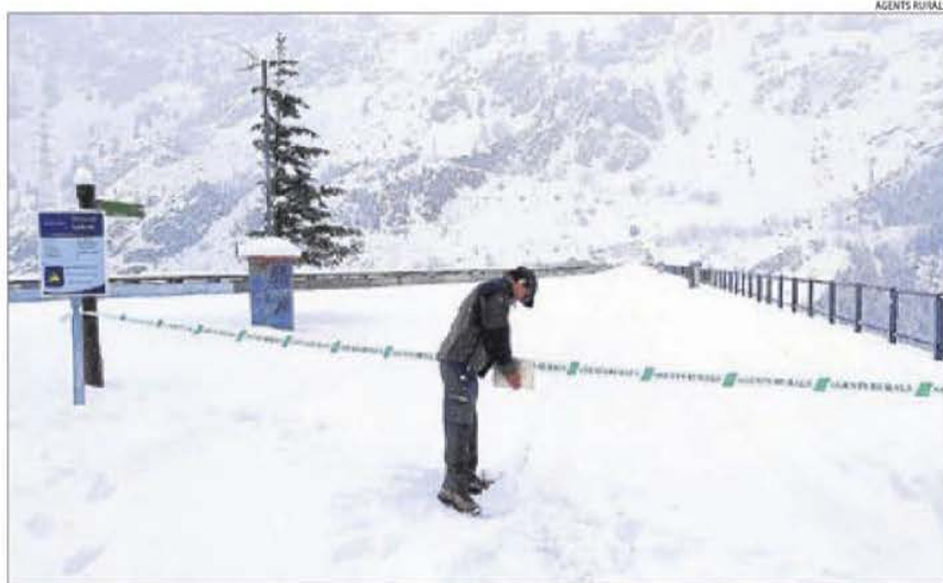
Un agent rural barrant aquesta setmana el pas a la presa de Sallente, a la vall Fosca.

Només estan permesos els desplaçaments per anar al lloc de feina (finques agrícoles, instal·lacions ramaderes,