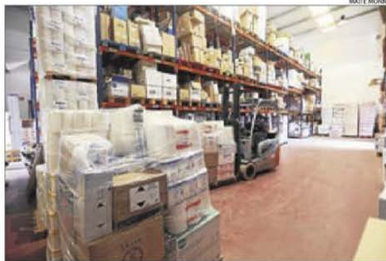
Imatge de les instal·lacions d'Ilerda Serveis.

Sobre aquest últim punt, Cerón va recalcar que “nosaltres