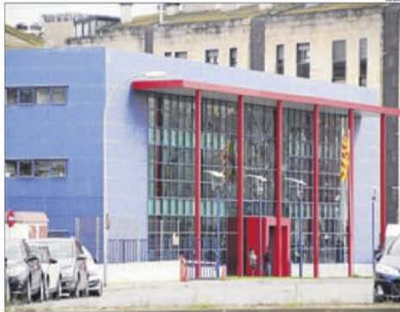
Imatge de la comissaria dels Mossos a Lleida.